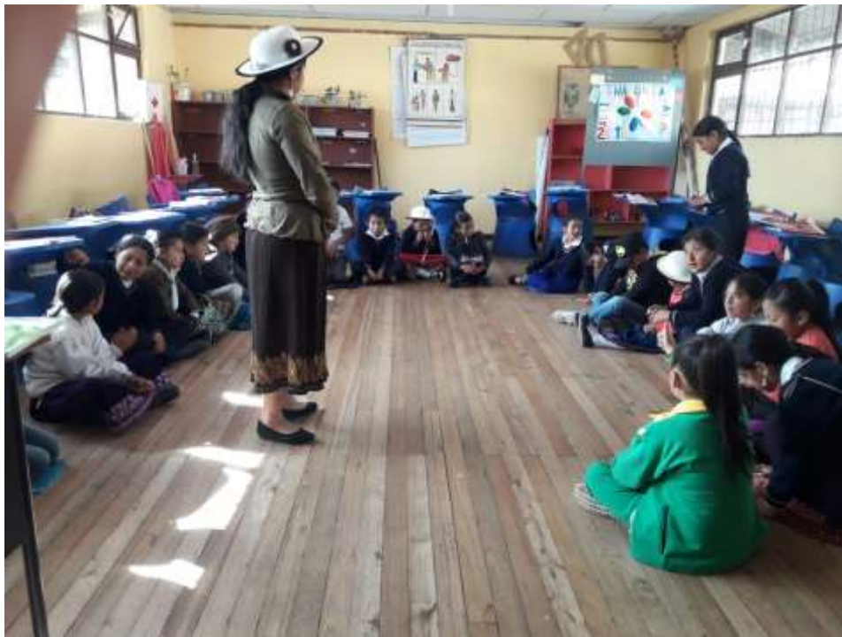
Figura 2. Participación de los estudiantes ante la importancia de los mitos y leyendas

“Es importante generar valores ante los conocimientos de nuestros antepasados, sus enseñanzas por medio de leyendas”.