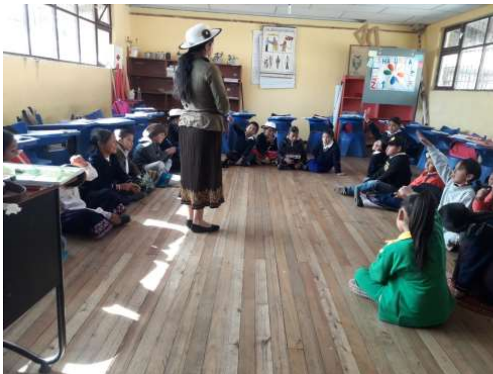
Figura 1. Diálogo de las leyendas con los estudiantes

Con las planificaciones antes expuestas, se llevó a cabo un diálogo a manera de una clase con los estudiantes del cuarto Año de Educación General Básica Media. Durante el dialogo se evidenció mucha atención y el gran interés que tienen los niños por conocer leyendas que nuestros abuelos supieron valorar, sobre todo la riqueza de la sabiduría ancestral de los pueblos indígenas. Los cuentos relatados generaron curiosidad e inquietud por conocer más, las preguntas fueron constantes, sobre cómo, por qué nuestros abuelos valoraban la naturaleza.