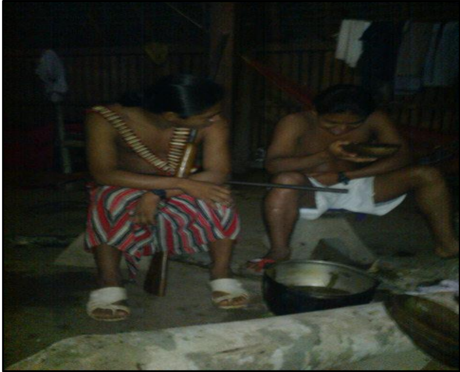
Fotografía tomada por Ramiro Shimpui (2017)