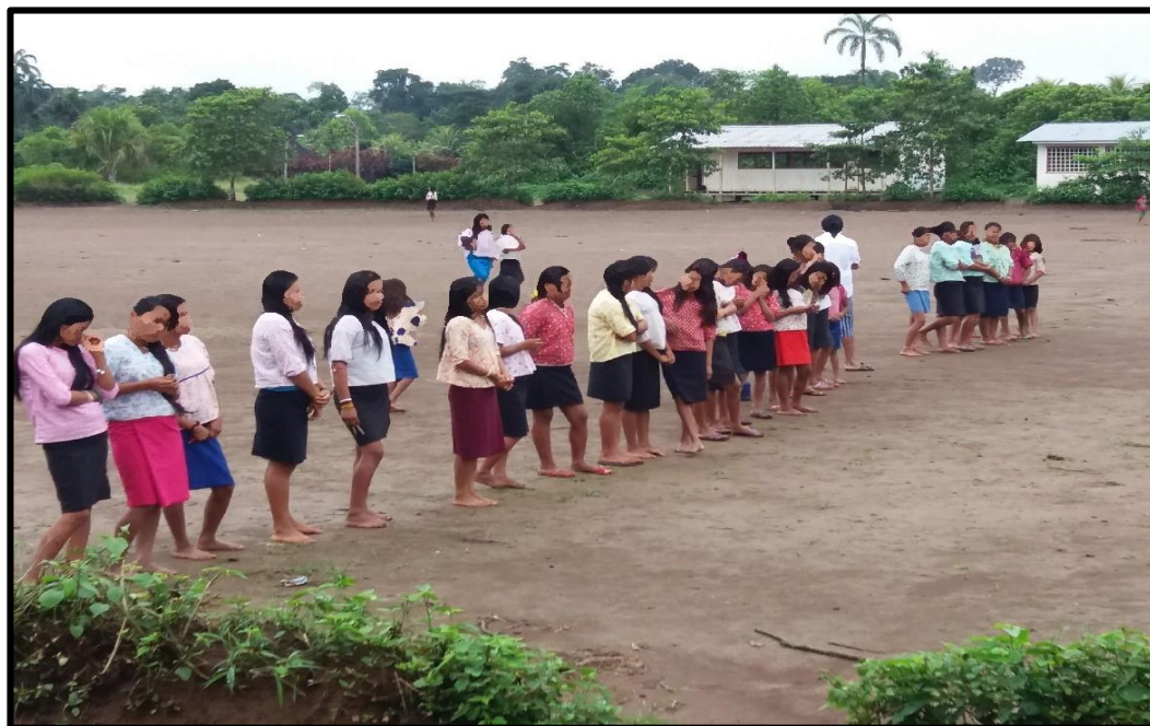
Fotografía tomada por Ramiro Shimpiu (2017)