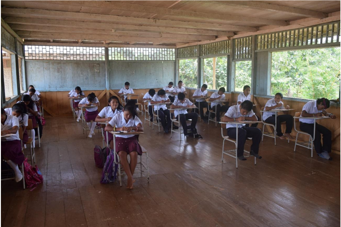
Año de publicación: 2017 Lugar se tomó: Wasakentsa Ecuador.