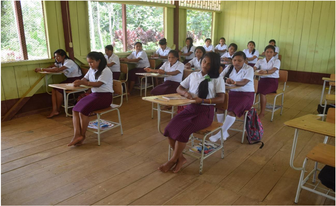
Archivo: Misión Wasak-entsa. Año de publicación: 2017 Lugar se tomó: Wasakentsa Ecuador.