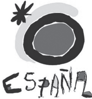
Figura 4. Logo de la marca turística española: El Sol de Miró

de marketing españolas, principalmente porque inició su recorrido en los años 80 y actualmente sigue en puestos líderes de imagen de marca. El logo de Miró está presente en todos los elementos de comunicación desarrollados por TURESPAÑA y se ha convertido en seña de identidad del turismo español.