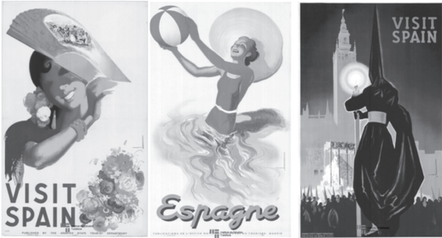
Figura 1. Ejemplos de carteles turísticos de España en la década del cuarenta