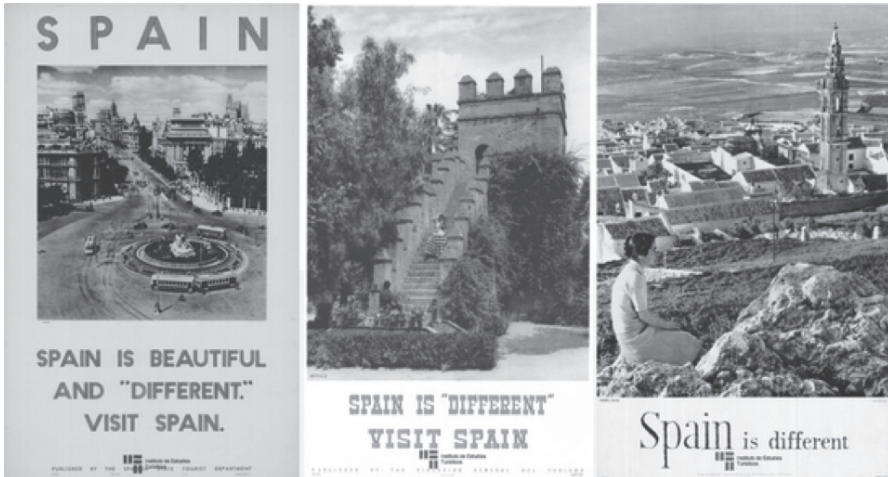
Figura 2. Ejemplos de la campaña «Spain is different»

Durante los años 50, el turismo en España comenzó a crecer rápidamente y el Gobierno creó un primer eslogan que se haría muy popular y que aún hoy se recuerda: « Spain is different » (figura 2). Esta nueva campaña, aunque continuó con la promoción cultural, comenzó a destacar el turismo de sol y playa, que era el que entonces se demandaba desde el extranjero y, por ello, sería la única imagen que se proyectara durante años.