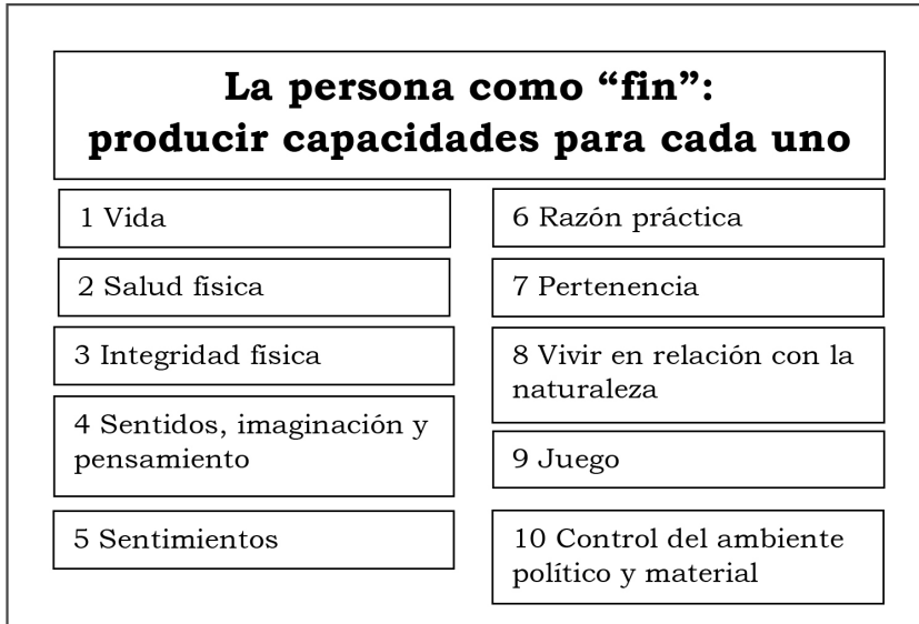
Cuadro 1. La taxonomía de las diez capacidades