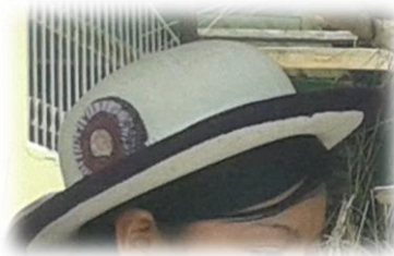
Figura No. 8 Sombrero.

Sombrero: Realizado de lana rebeteado, las mujeres de avanza edad no utilizan los decorativos; es importante manifestar que los de actualidad llevan decorativos que constan de una cinta blanca, flores realizados con cinta de colores y cordón que porta a los warminchis, cada uno de estos significa la alegría y la pureza de la mujer, que va siempre relacionado con la madre naturaleza.