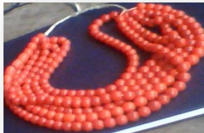
Figura No. 10 Collar rojo.

Aretes: La mujer utiliza como adorno diario, lleva diseños como: pájaros, ramas, sol y luna que son símbolos que representan al pueblo cañari, son de plata y de acero.