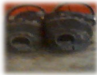
Figura No. 7 Oshotas.

Oshotas: Los ancestros cañaris utilizaban las alpargatas o caminaban descalzos; al pasar los tiempos aparecen las oshotas tipo sandalia que eran elaborados con caucho, hoy en día estos son remplazados por otro tipo de calzado más occidental.