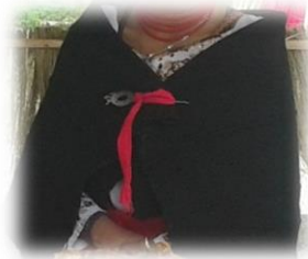
Figura No. 11 Lliklla.

mucho valor pero desconocen la decoración. Se coloca en el cuello de la mujer, tiene de seis a ocho sartas, el color significa la fuerza y valentía de la mujer cañari.