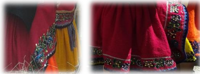
Figura No. 14 Pollera de bayeta.

Tupo: Es un prendedor que sostiene a la wallkarina, para las mujeres cañaris significa una arma para la defensa, es elaborada de plata o de bronce y va acompañada con una cinta rosada o roja.