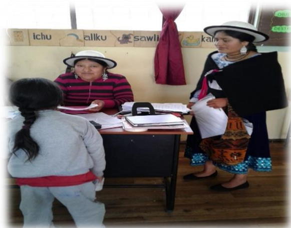
Figura No. 15. Encuesta a los docentes.