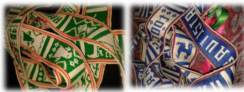
Figura No.5 Faja.

mientras que antes solo se diseñaba el animal caracol, en el mundo indígena el churuco significa que los indígenas siempre caminamos en círculo.