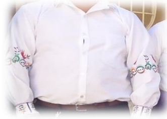
Figura No. 3 Camisa.

Poncho: En los tiempos de los ancestros utilizaban poncho de color negro tejido de lana de borrego que servía para la protección del frío, hoy en día los ponchos son de color rojo, poco se observa de color negro que son visibles en las fiestas.