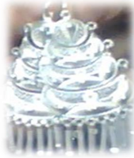
Figura No. 9 Aretes.

Aretes: La mujer utiliza como adorno diario, lleva diseños como: pájaros, ramas, sol y luna que son símbolos que representan al pueblo cañari, son de plata y de acero.