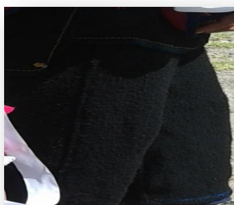
Figura No. 6 Pantalón de bayeta.

Faja: Conocida como chumpi usada para sujetar la cushma y el pantalón. Es la prenda que representa la cosmovisión cañari porque lleva símbolos religiosos y de animales; a más de ello, algunos ancestros tejían poniendo nombre de sus hijos y fechas de nacimiento.