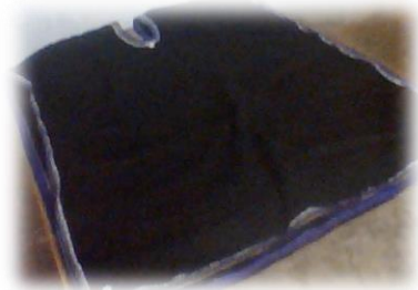
Figura No. 4 Kushma.

Camisa bordada: Es de color blanco bordado en los puños, codo y cuello, era confeccionado a mano, por las mujeres; los bordados siempre estaban relacionados con la naturaleza; en la actualidad, los bordados son realizados en una máquina, cada bordado significa el florecimiento, productividad y fuerza del hombre cañari.