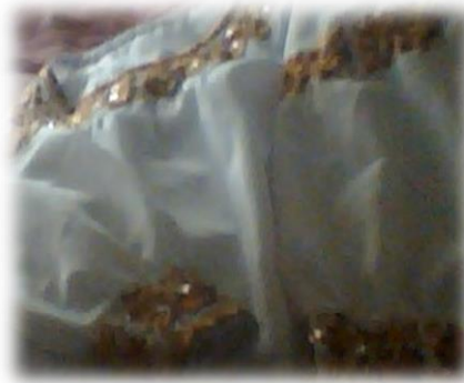
Figura No. 12 Blusa.

Blusa: La blusa blanca es bordada en el puño, codo y cuello, el bordado representa la abundancia de frutos y plantas de la madre naturales, significa la pureza de la mujer cañari.