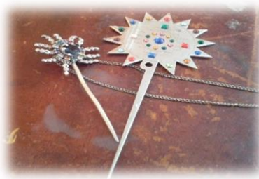
Figura No. 13 Tupo.

Blusa: La blusa blanca es bordada en el puño, codo y cuello, el bordado representa la abundancia de frutos y plantas de la madre naturales, significa la pureza de la mujer cañari.