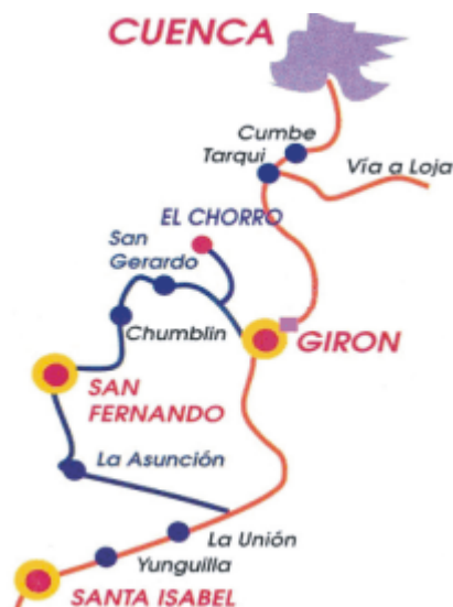
Ilustración 1: Provincia del Azuay