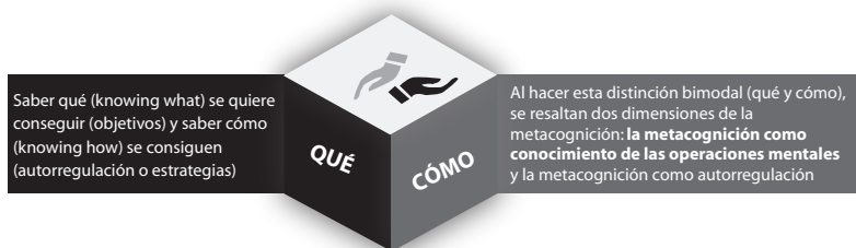
Imagen 1 Características de la cognición madura

En resumen, si revisamos la bibliografía sobre metacognición surge que la madurez metacognitiva supone que todo educando es cognitivamente maduro cuando puede dilucidar qué es comprender y cómo puede llegar a alcanzar esa meta (qué estrategias ha de usar, cómo manejará la información para transformarla en conocimiento, cuáles son los modos de dotarla de sentido, etc.) (Imagen 1).