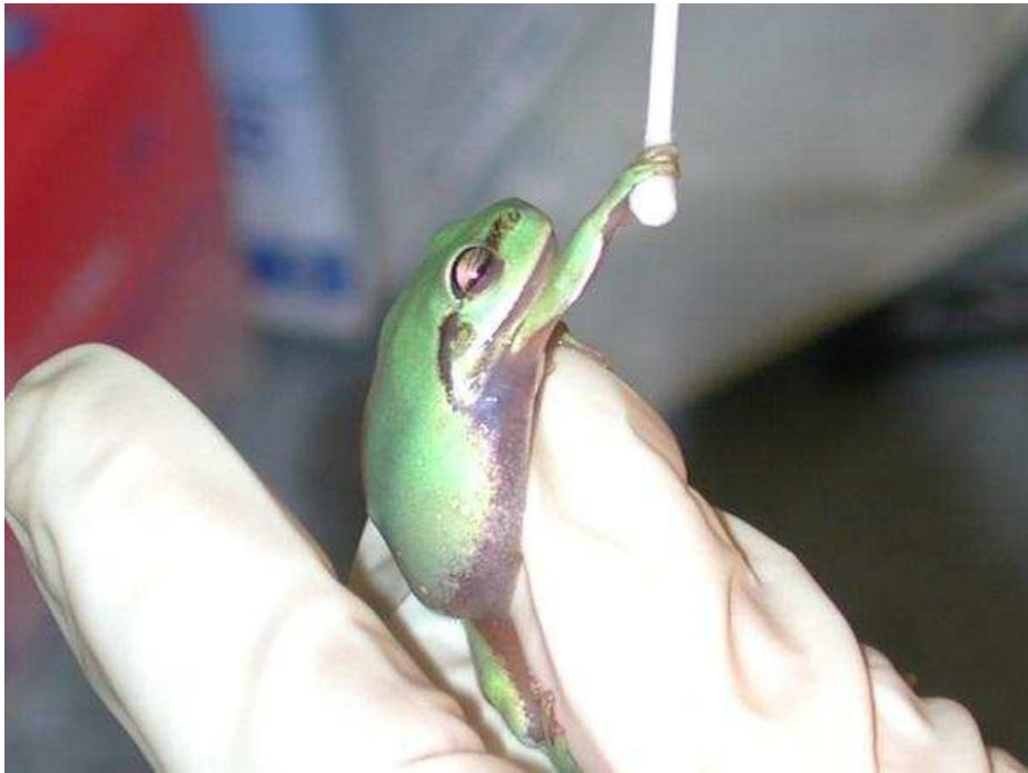
Figura 2. Forma de tomar una muestra epidérmica en anfibios adultos para detección de B. dendrobatidis (Amphibiaweb.org, 2015).

Dentro de este contexto, generalmente se considera que el avance de la quitridiomycosis se exagera con los distintos tipos de intervención antrópica que ocurren en los bosques nativos, así como con el avance de actividades industriales y de expansión urbana, las cuales contribuyen al efecto invernadero contemporáneo (Yáñez et al. , 2011), el cual a su vez crea escenarios más favorables para el avance de patógenos que afectan mayormente a los anfibios (Wake y Vredenburg, 2008).