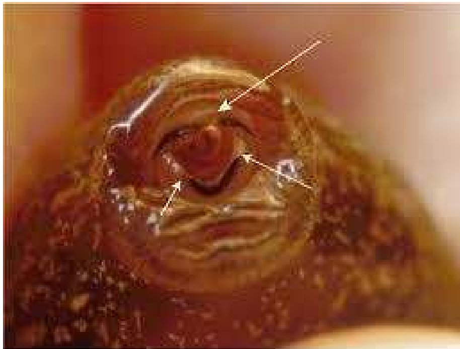
Figura 1. Boca de renacuajo. Las flechas indican zonas queratinizadas de donde se puede tomar una muestra para detección de Batrachochytrium dendrobatidis (Sierra Nature Notes, 2015).

Batrachochytrium dendrobatidis es una especie de hongo que pertenece al grupo conocido como quitridios. Este grupo de hongos hasta hace unos años sólo infectaba a plantas, algas, protistas e invertebrados, pero hace unos años se descubrió que B. dendrobatidis es el único quitridio capaz de infectar vertebrados, particularmente anfibios (Lawrence, 2008). Esta especie de hongo se encuentra solamente en las partes queratinizadas del cuerpo de los anfibios, como la boca de los renacuajos (Figura 1) y toda la piel de los anfibios adultos (Figura 2). Se cree que específicamente se relaciona con la queratina que se encuentra en estas células ya que están muertas y se pueden invadir con mayor facilidad (Piotrowski et al. , 2004).