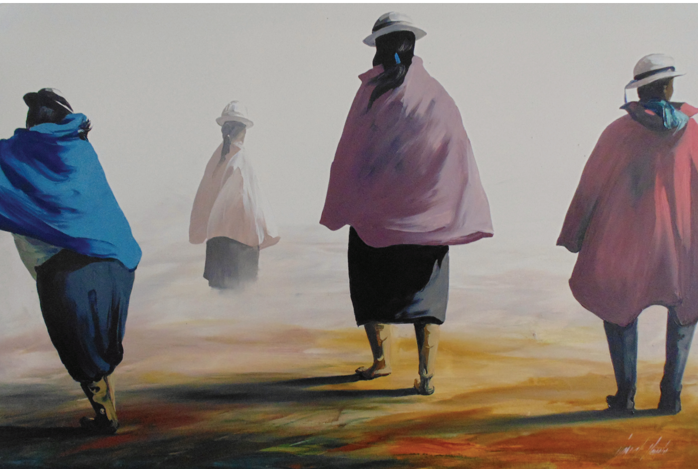
CAMINANTES DE LA SIERRA Oleo sobre lienzo 120 x 80 cm

la provincia el 16.8% de la muestra provino de Chimborazo, otro 16.8% de Tungurahua, el 14.2% de Morona Santiago, un 9.8% de Bolívar, otro 9.8% de Sucumbíos, un 9.2% de Imbabura, un 8.5% de Cotopaxi, el 7.6% de Pichincha y el último 7.3% de Cañar. En relación al tipo de oferta académica, el 67.4% de las encuestas se realizaron en instituciones de educación general básica, el 13.9% en instituciones de bachillerato general unificado, un 1.9% en instituciones de educación inicial. Hubo un 16.7% que contaban con diferentes modalidades, pero en las cuales la principal era la de educación general básica.