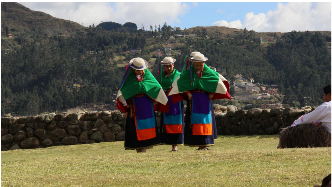
Parque Arqueológico Pumapungo (Grupo Wayrapamushkas)