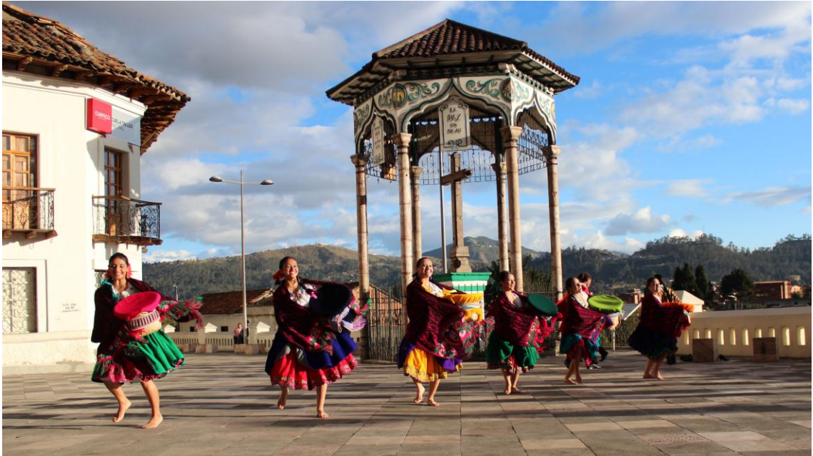
Cruz del Vado (Grupo Yawarkanchik)