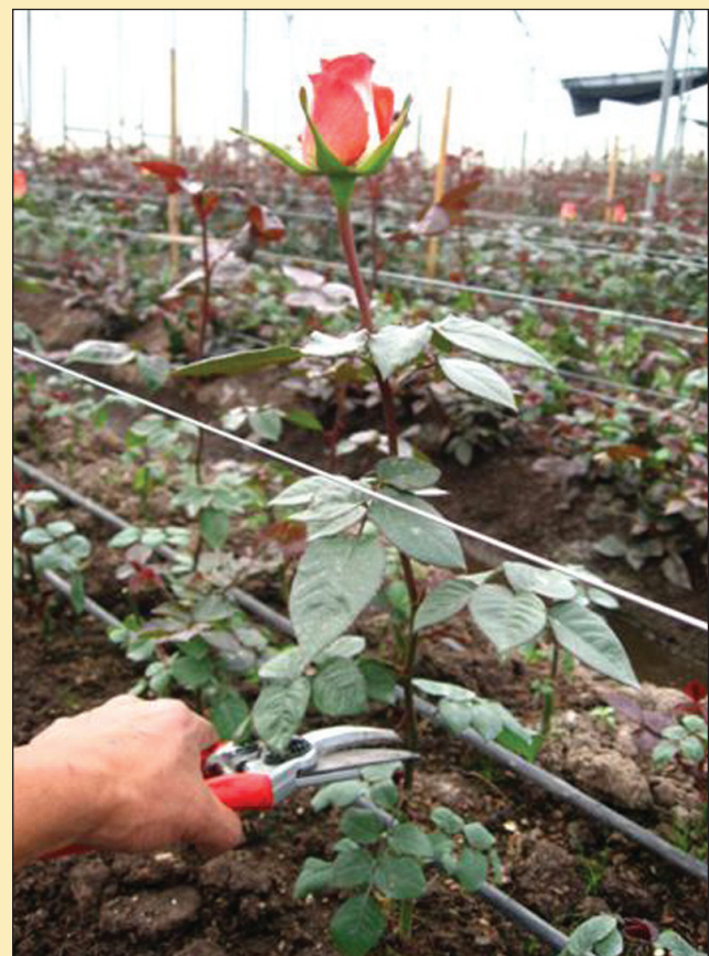
Figura 6. Cosecha de la primera flor en punto ruso.