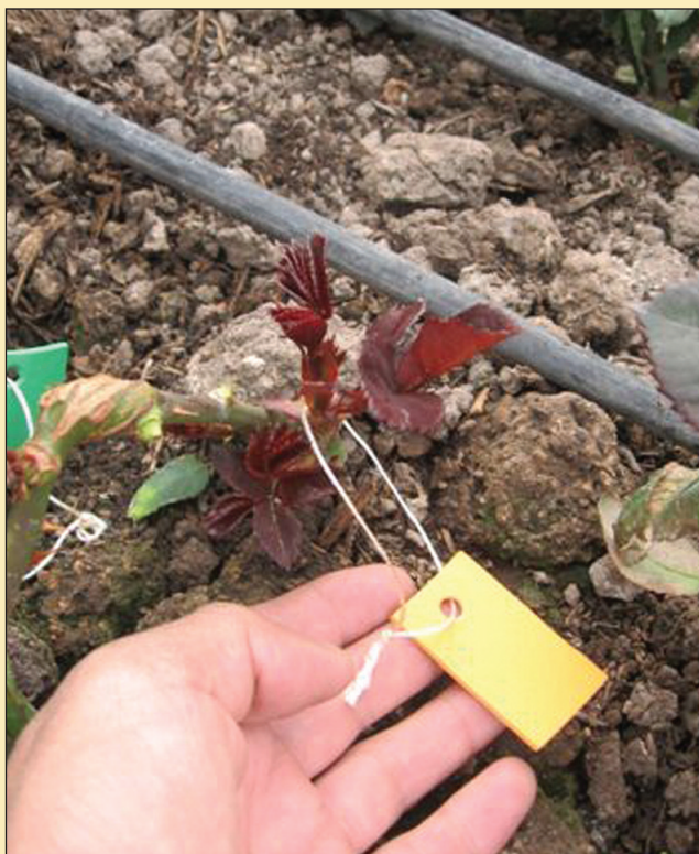
Figura 9. Basales brotados.

ple con la labor de eliminar la dominancia apical en los tallos de la plántula de rosa, con lo cual se induce a la brotación de las yemas bajas (Ver Figura 9), que en este caso son las que dan origen a los brotes basales.