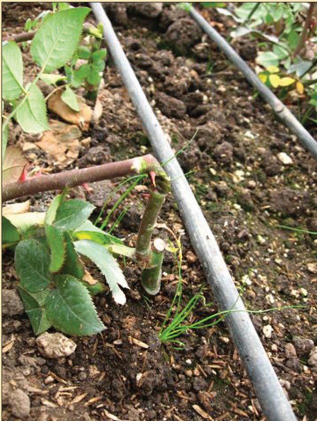
Figura 4. Agobio de plántulas con semiquiebre.

Una vez que las plántulas se encontraron estableci-