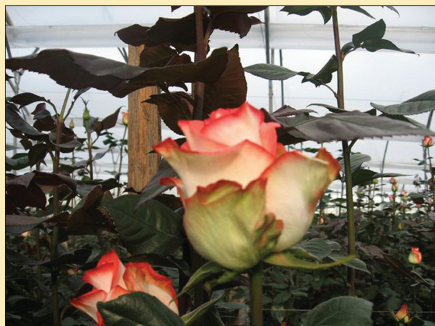
Figura 1. Variedad 'Blush de los Andes'.

Es sumamente importante asegurar el número de yemas basales, su número depende de la edad y la posición de la yema y, generalmente, sólo las dos yemas inferiores entre las yemas potenciales producen brotes basales. Si más tarde se desarrolla un tercer brote o más, provendrá de la yema axilar de uno de los dos brotes ya crecidos, diferentes factores afectan la formación y calidad de los brotes basales (López et al., 2007).