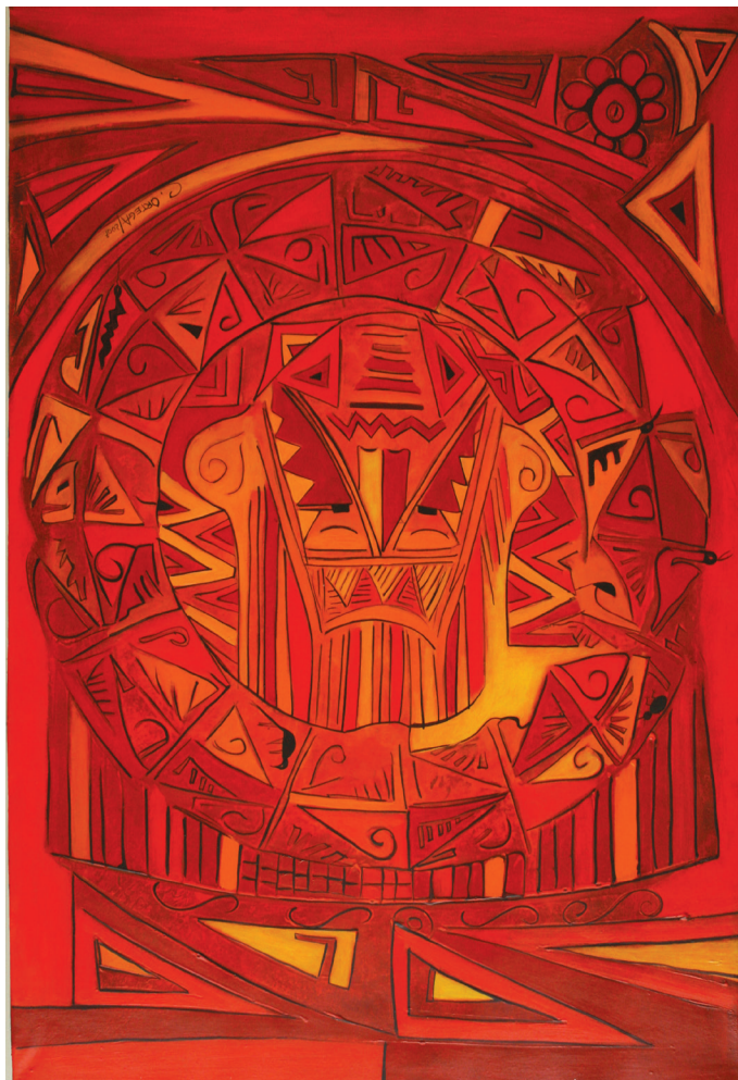
CONEXIÓN Acrílico sobre tela 70X90

Otra diferencia se establece con relación a la definición de la mejor evaluación . La mayoría de los docentes de las EEC delimitan una interesante imagen que no coincide con el concepto que poseen, ni con las prácticas que desarrollan