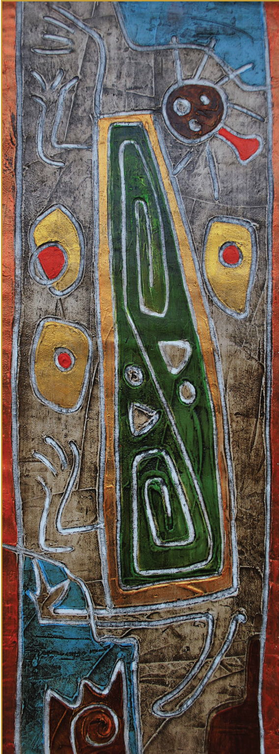
Punchana (Guatuzá) Mixta 2010

su vida. Hoy contemplamos a Jesucristo tal como nos lo transmiten los evangelios para conocer lo que Él hizo por nosotros y para invitarnos a discernir qué es lo que nosotros debemos hacer hoy” (ibíd., n. 139).