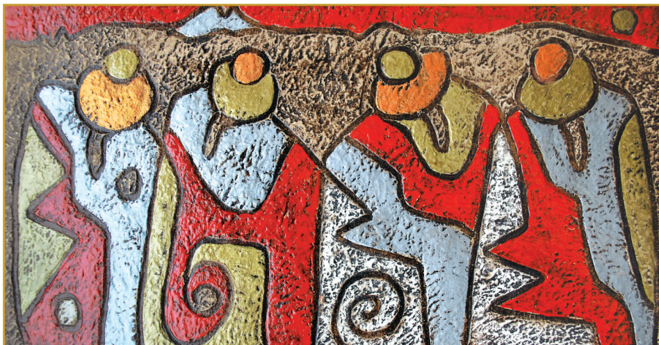
Ayllu (Familia) Mixta 2010

historia. Hay que luchar por una sociedad basada en el derecho y la justicia (cfr. Jer 21,11-22, 4). El amor hacia el prójimo posee una dimensión histórica, que se debe concretizar en la acción exigida por las nuevas circunstancias siempre cambiantes. Hoy se requieren nuevas mediaciones, que den al amor cristiano la eficacia que le falta en ocasiones: “exigencias como la no-violencia cristiana, la protección del ambiente, la planificación responsable de la familia, la prevención sanitaria, la responsabilidad política y otras, pueden tener, por lo menos, tanta importancia como los preceptos particulares, que anteriormente eran considerados y predicados como el contenido del amor al prójimo” (Rahner, 1984: 15).