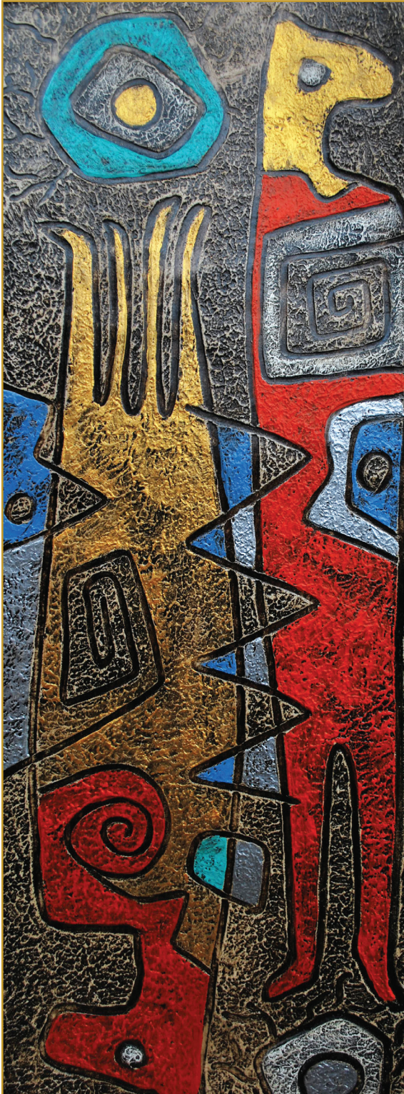
Andi (Andes) Mixta 2010

socorramos las necesidades urgentes, al mismo tiempo que colaboremos con otros organismos o instituciones para organizar estructuras más justas en los ámbitos nacionales e internacionales. Urge crear estructuras que consoliden un orden social, económico y político en el que no haya inequidad y donde haya posibilidades para todos” (ibíd., n. 384; cfr. 385-386).