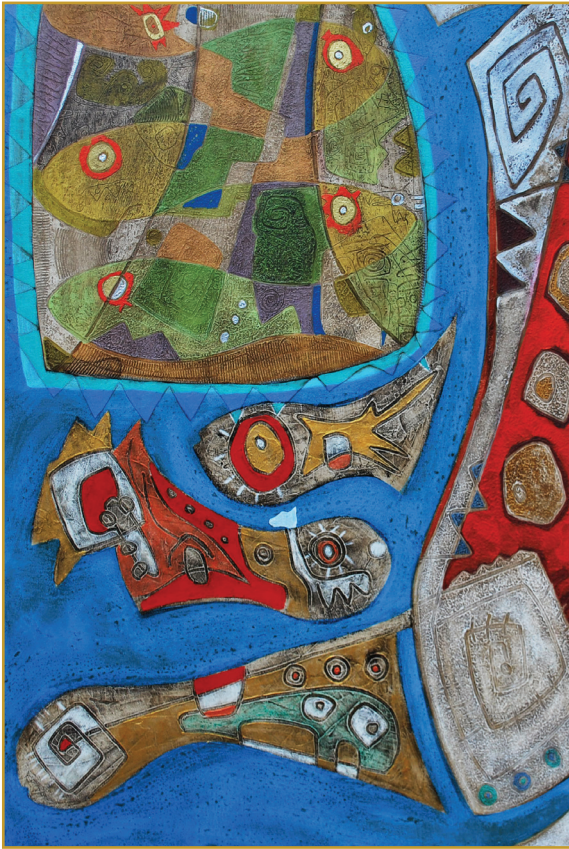
Iñu (Punto de inicio) Mixta 2010

Entre los signos de esperanza que animan la espiritualidad en América Latina y El Caribe está la caridad de tantas personas anónimas en medio de las injusticias y adversidades. Su testimonio manifiesta la cercanía del poder salvador y liberador del reino de Dios “que nos acompaña en la tribulación y que alienta incesantemente nuestra esperanza en medio de todas las pruebas” (ibíd., n.30).