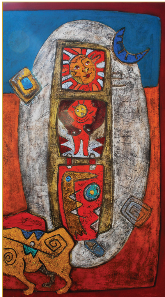
Pachataway (Tejiendo el tiempo, espacio... la vida) Mixta 2010

María es también “la gran misionera continuadora de la misión de su Hijo y formadora de misioneros. Ella, así como dio a luz al Salvador del mundo, trajo el evangelio a nuestra América”