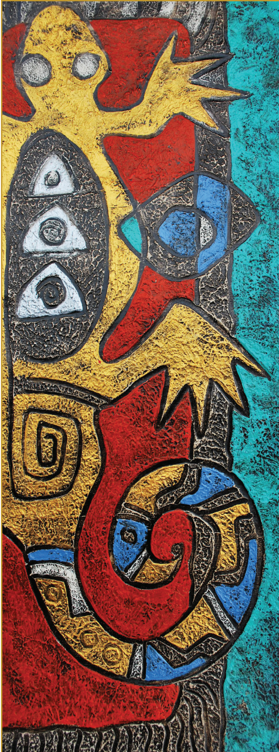
Waksa (Lagarto sabio) Mixta 2010