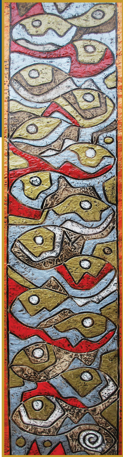
Aychawaykuna (Pescadores) Mixta 2010