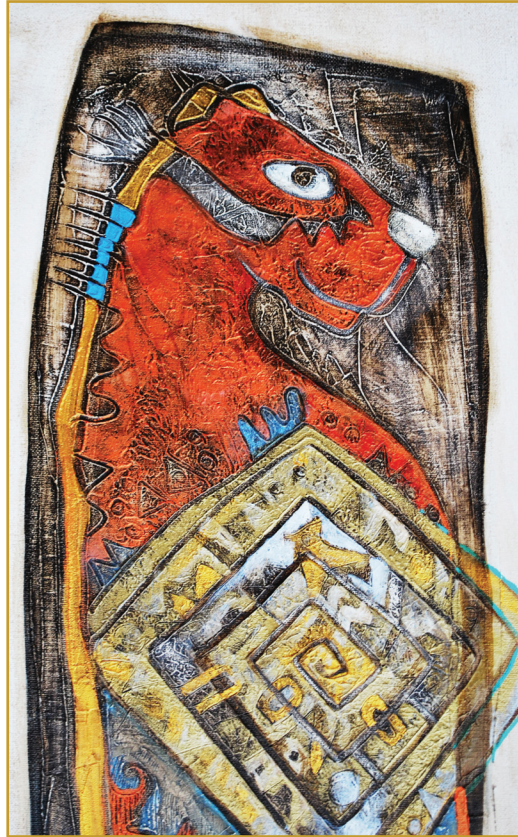
Pumakay (Ser puma) Mixta 2010

La primera exigencia para la misión evangelizadora es la de la renovación de la vida,