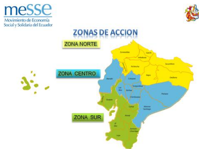
Gráfico N° 1 Zonas de Acción del MESSE