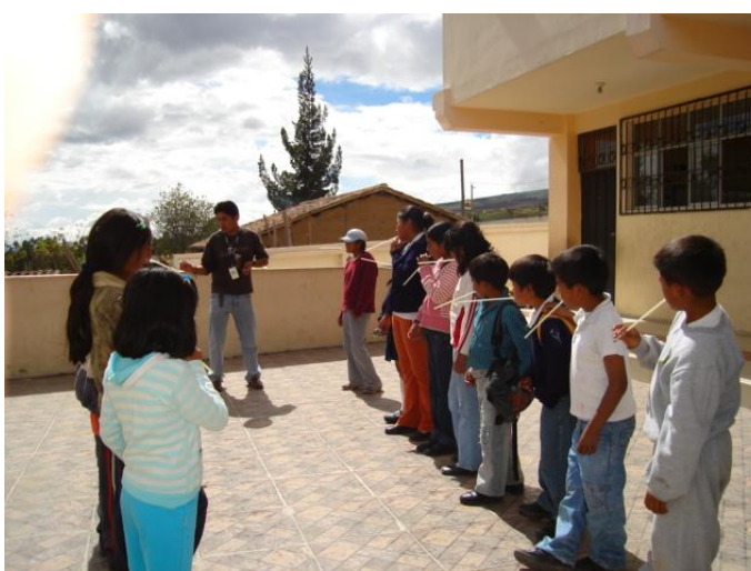
Taller a niños y niñas de la parroquia de Tocachi 60