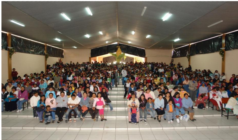
Auditorio de la Escuela Santa Clara de Asís para la entrega de apoyos económicos a las familias de las cinco parroquias del Cantón