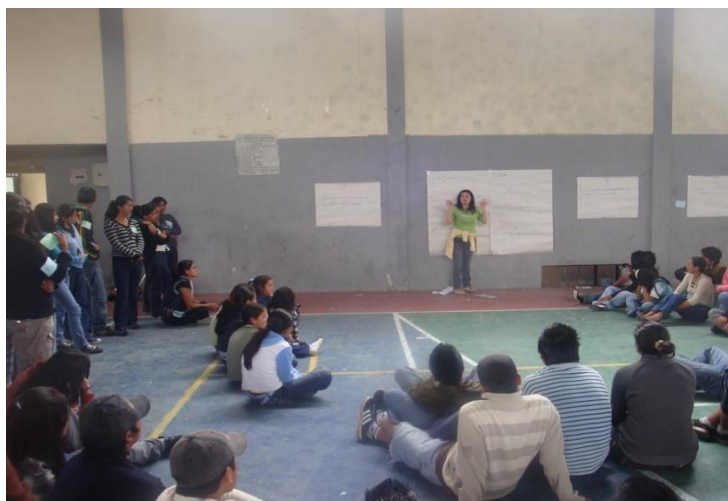
Asamblea parroquial de adolescentes y jóvenes de la parroquia de Tabacundo

En la adenda consta en el ítem décimo as formas de liquidación del convenio donde consta que se debía de entregar la liquidación los primeros cinco días hábiles; la organización entregó la liquidación en el mes de febrero 2011, desde esa fecha se desconocen las causas por las que no se liquidó la última adenda. De igual manera desde el área jurídica y financiera de la Dirección Provincial del MIES INFA Pichincha, desconocen las causas para no contar una acta finiquito del convenio firmado en el 2011 hasta la actualidad que es abril del 2012.