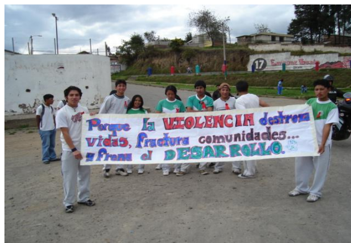
Niños, niñas y adolescentes marchan por el día internacional de la No Violencia en la parroquia de Tabacundo