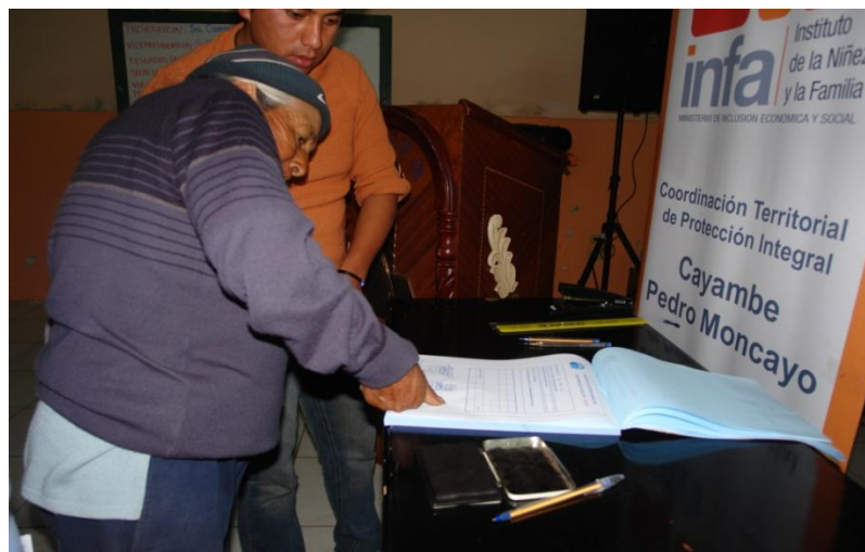
Representante de beneficiario firma la carta compromiso donde se compromete a garantizar la permanencia y culminación de su representado.