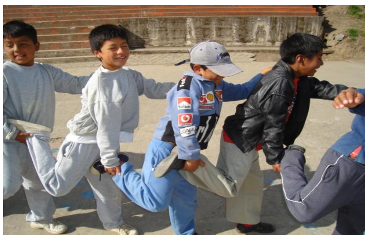
Niños y niñas participan en ejercicios que mejoran la motricidad gruesa y el valor de trabajar en equipo