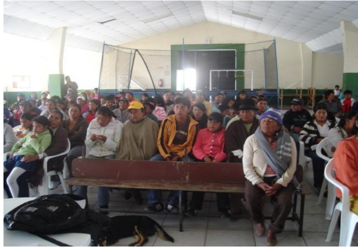
Participación de padres y madres de familia en la parroquia de Tupigachi 54

En el cuarto año del 2008, se incrementan los apoyos económicos a $80.00 dólares, es así, que los presupuestos de las organizaciones contraparte ascienden a $19.004.00 por parte del INNFA, el Gobierno Municipal con $21.624.00 dólares y el Patronato Municipal con $6.625; es decir que el convenio fue un total de $46.253. Pero el equipo de campo es insuficiente para realizar el seguimiento a los NNA y sus familias que reciben este apoyo, ya que solo son dos personas para ese trabajo con una cobertura mucho más grande que el año anterior, lo que dificulta un acercamiento continuo a las familias y escuelas.