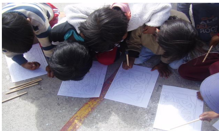
Niños y niñas a través de técnicas lúdicas desarrollan capacidades de razonamiento lógico 51

En la tercera etapa existen mayores conocimientos sobre el proyecto y se empieza a tener ya experiencia del funcionamiento de la modalidad. Para el 2007, el Gobierno Municipal incrementa su cofinanciamiento provocando una cobertura de 371 becas en el cantón distribuidas en las cinco parroquias, la cantidad se mantenía de los $70.00 dólares. En ésta etapa el aporte del INNFA era similar al del año pasado de $17.050 dólares, el Gobierno Municipal aporta con $22.324.00 dólares y Patronato Municipal $5.625.00 dólares ascendiendo a un monto total de $44.999.00 dólares.