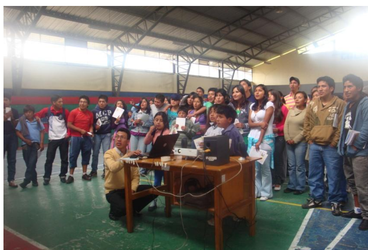
Asamblea parroquial de adolescentes y jóvenes de la parroquia de Malchingui