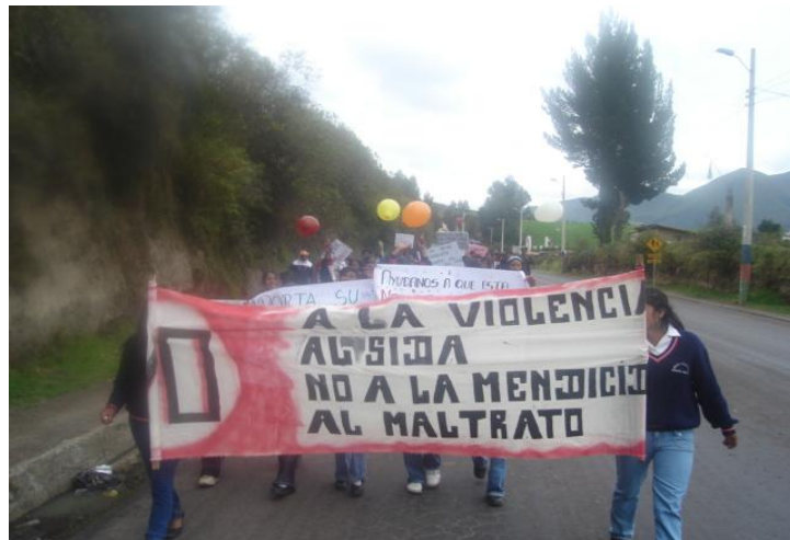
Niños, niñas y adolescentes marchan por el día internacional de la No Violencia en la parroquia de Tupigachi

madre, día de difuntos, etc. los y las trabajadoras salen de sus trabajos a altas horas de la noche y salen muy temprano de sus hogares, provocando abandono de sus hijos e hijas.