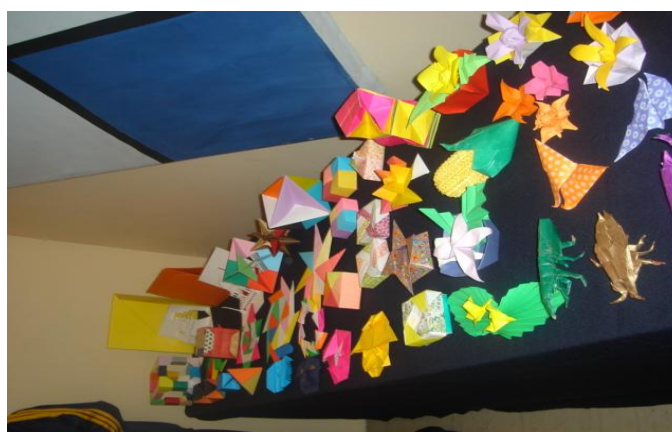
Niños, niñas y adolescentes que son parte del proyecto y de la comunidad elaboran figuras de origami en la parroquia de Tupigachi 56