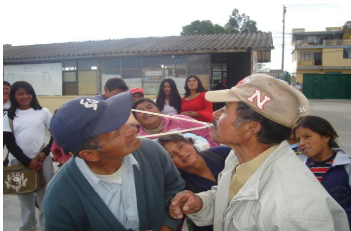
Participación de padres y madres de familia en la parroquia de Malchingui