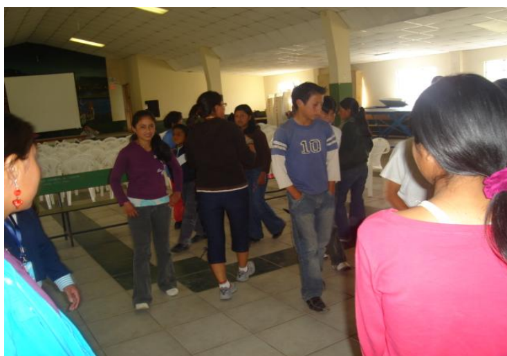
Adolescentes en talleres de reconocimiento y autoestima en la parroquia Malchingui