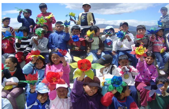
Niños, niñas y adolescentes que son parte del proyecto y de la comunidad participan en la elaboración de flores con material reciclado en la parroquia de Tabacundo