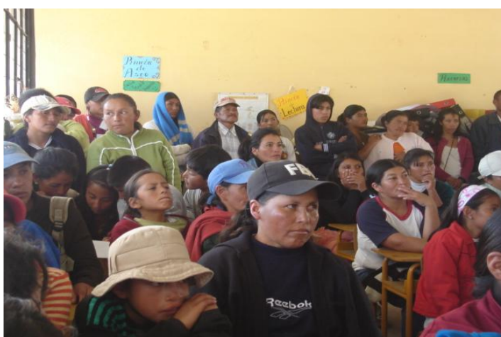
Participación de padres y madres de familia en la parroquia de La Esperanza