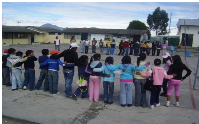
Niños, niñas y adolescentes que son parte del proyecto y de la comunidad participan de los campamentos en la parroquia de Malchingui.