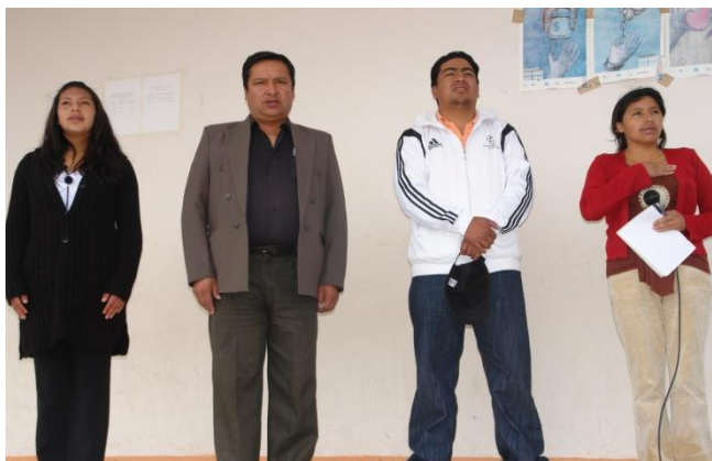
Autoridades del Cantón Pedro Moncayo inauguran los campamentos vacacionales para todas las parroquias

Uno de los cuellos de botella que han sido permanentes en todo el proyecto pero se hace más evidente en éste periodo fueron los cambios del equipo comunitario y de coordinadores no por mal ejecución en sus funciones, sino por cuestiones de simpatía partidista pues cambiaban con cada administración debilitando la ejecución del proyecto.