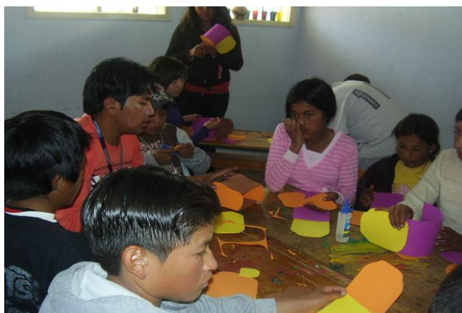
Niños, niñas y adolescentes que son parte del proyecto y de la comunidad participan en la elaboración de canastas en la parroquia de Tocachi