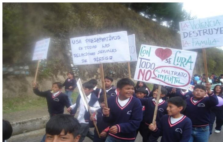
Niños, niñas y adolescentes marchan por el día internacional de la No Violencia en la parroquia de Tupigachi