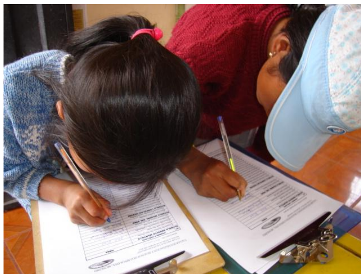
Niños y niñas tenían refuerzo pedagógico en lenguaje