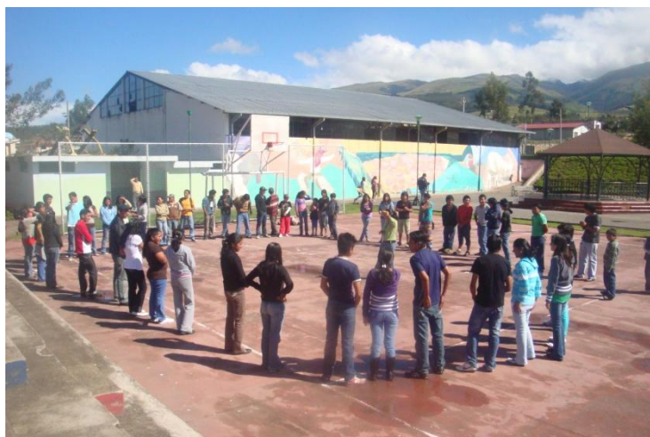
Asamblea parroquial de adolescentes y jóvenes de la parroquia de Tocachi