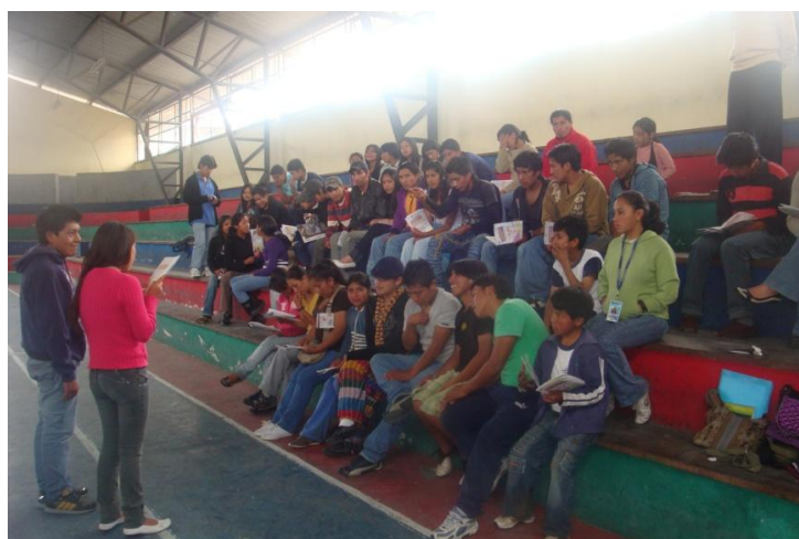
Asamblea parroquial de adolescentes y jóvenes de la parroquia de Tupigachi 63