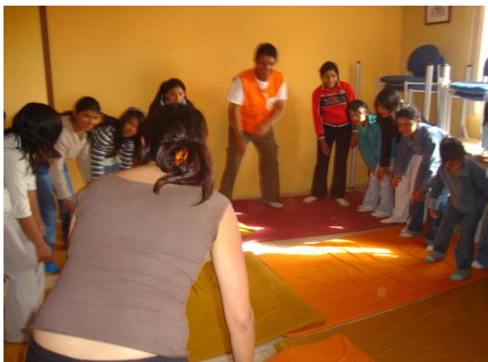
Taller de expresión corporal y autoestima en la parroquia La Esperanza