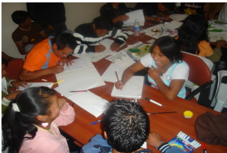
Niños, niñas y adolescentes en el taller de derecho a la educación