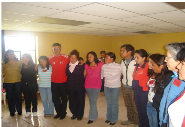
Grupo de maestros y maestras de la parroquia de Tabacundo