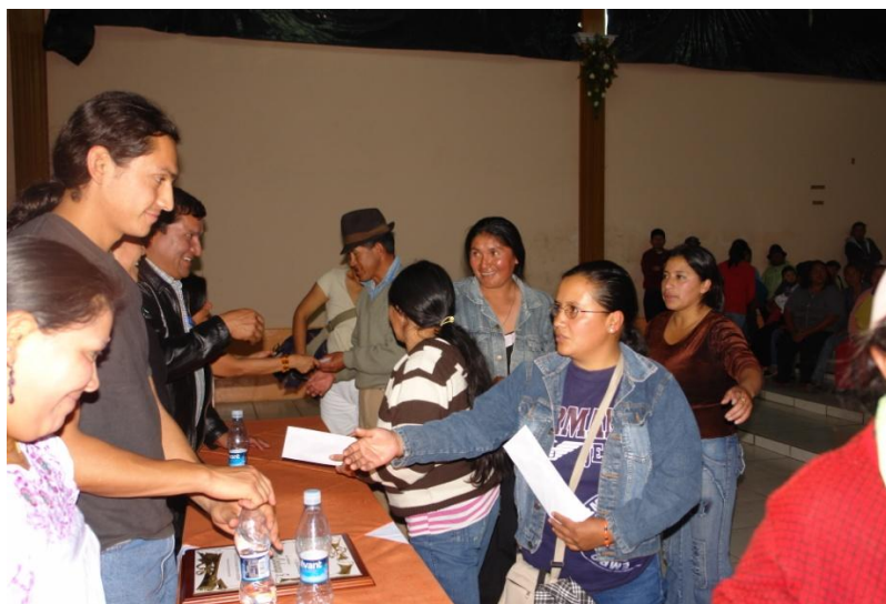
Autoridades del Cantón entregan los apoyos económicos a las familias 59