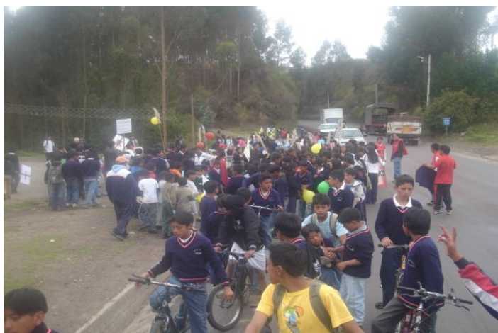
Triatlón por el día internacional de la No Violencia de los niños, niñas y adolescentes en la parroquia La Esperanza 53