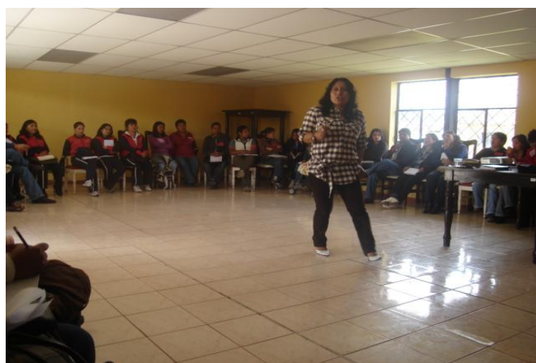
Grupo de maestros y maestras de la parroquia de Tocachi 50

Para que inicie la segunda etapa se realiza una evaluación en el año 2006 para evidenciar si se dio cumplimiento con los objetivos planteados; los resultados fueron positivos y se firma para la ejecución de la segunda fase. En este año se involucraron 85 niños, niñas y adolescentes al programa, estos apoyos fueron en un total de 285 beneficiarios y con el mismo monto de $70 dólares.