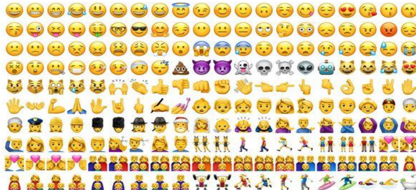
Figura 2. Emojis.

Mediante las redes sociales, se utiliza con frecuencia los emojis para enviar mensajes de texto, estas tipografías van incrustadas como referentes a palabras de forma gráfica. Para Sampietro et al (2016), “la difusión de las pequeñas caritas fue imparable, más aun con la popularización de los Smartphone y especialmente de las aplicaciones de mensajería instantánea” (p. 60).