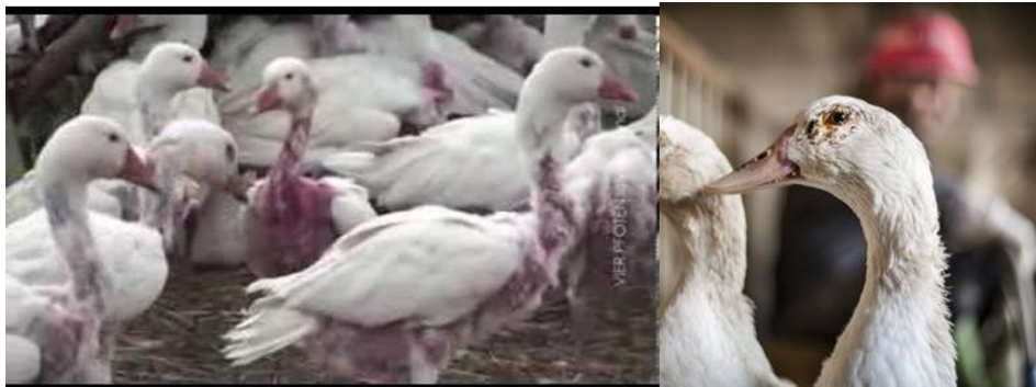
Figura 2. Patos o gansos después de ser desollados

de ser desolladas. Por otra parte, a los patos o gansos se les sacan las plumas aún estando vivos, ya que el pelaje vuelve a crecer; por lo tanto, no es necesario matarlos. Las imágenes expresan el sufrimiento y la crueldad que experimentan estos seres indefensos (ver Figura 2) [4].