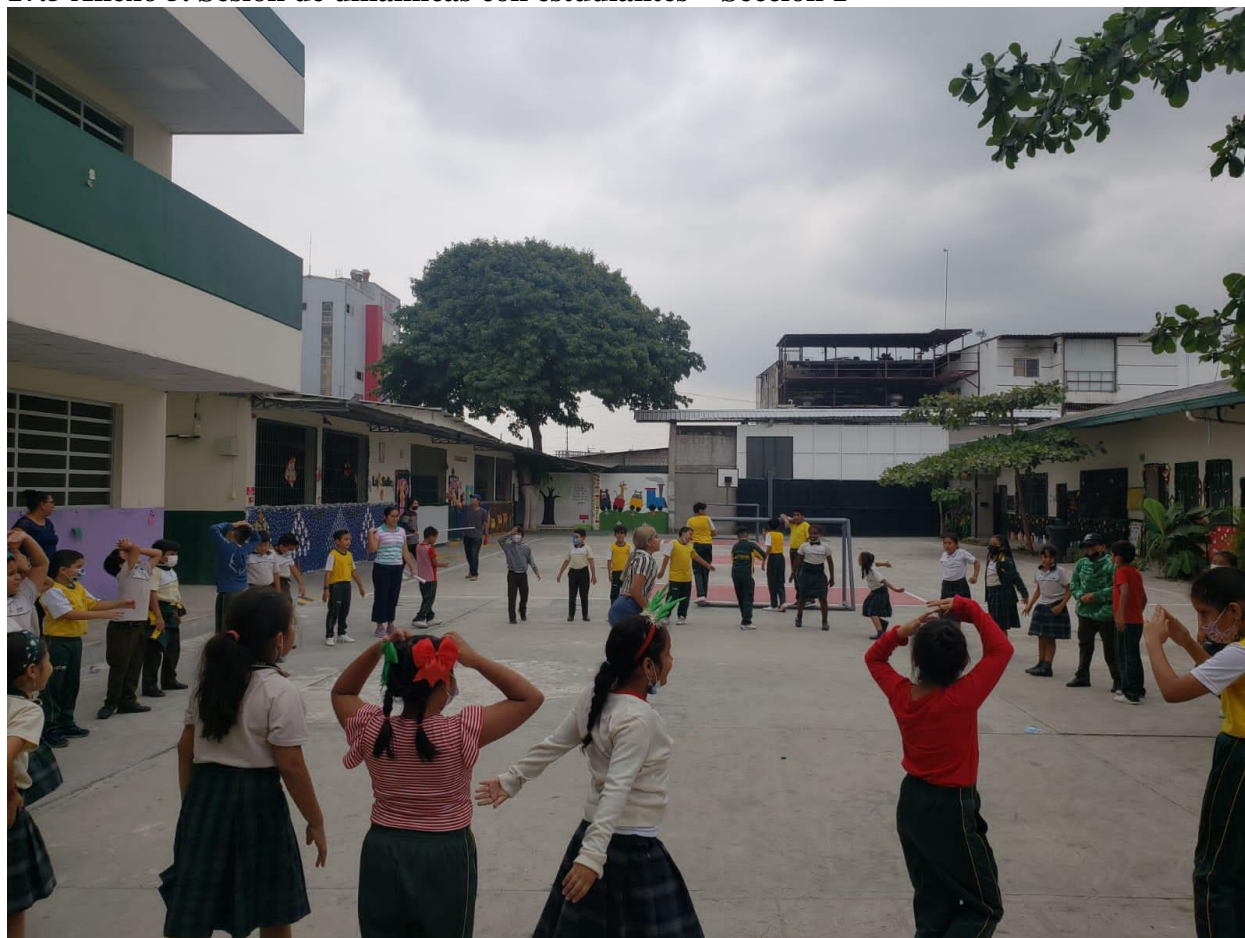
Figura 5. Sesión de dinámicas con estudiantes Sección 1.