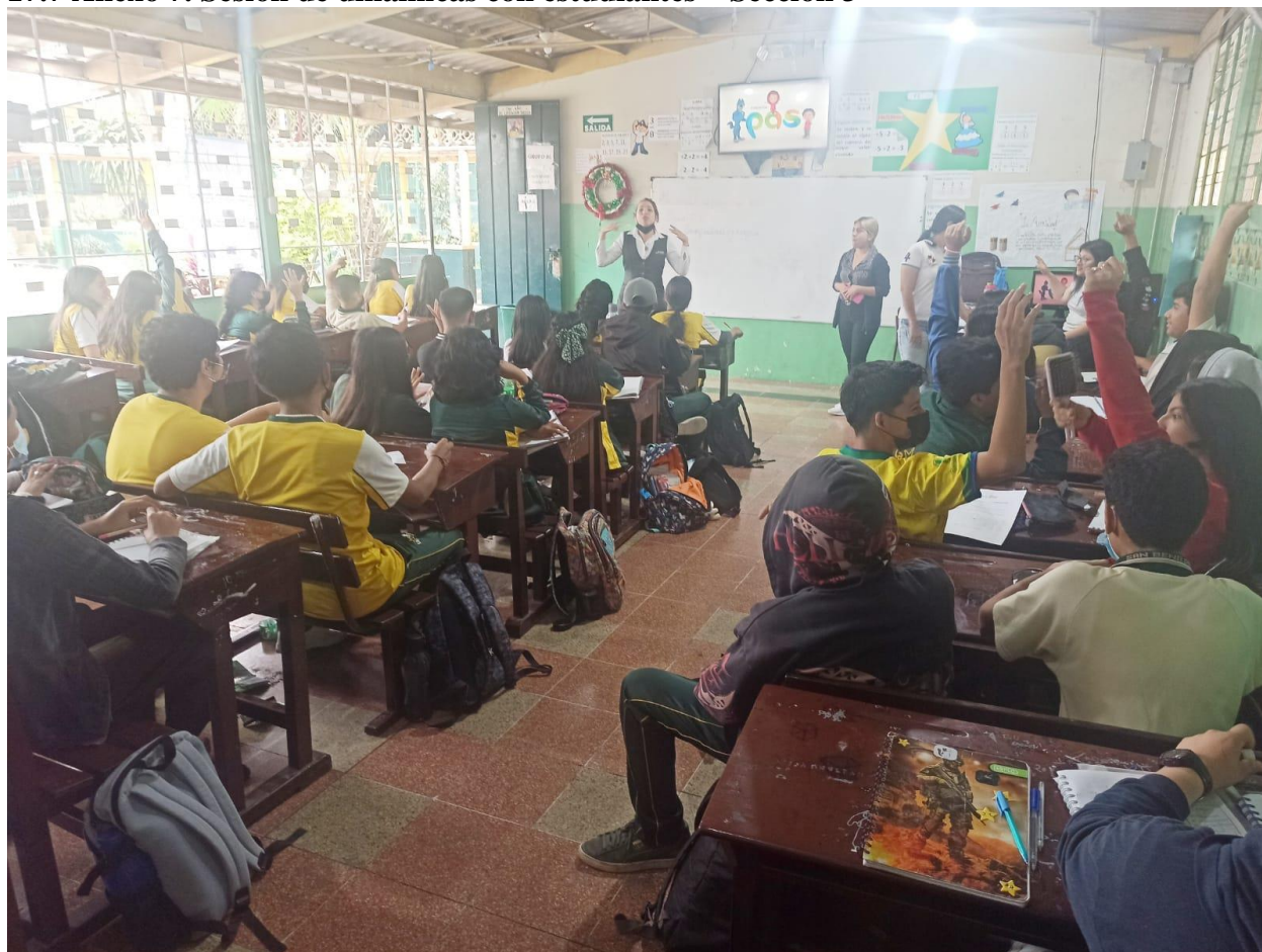
Figura 7. Sesión de dinámicas en el aula Sección 3