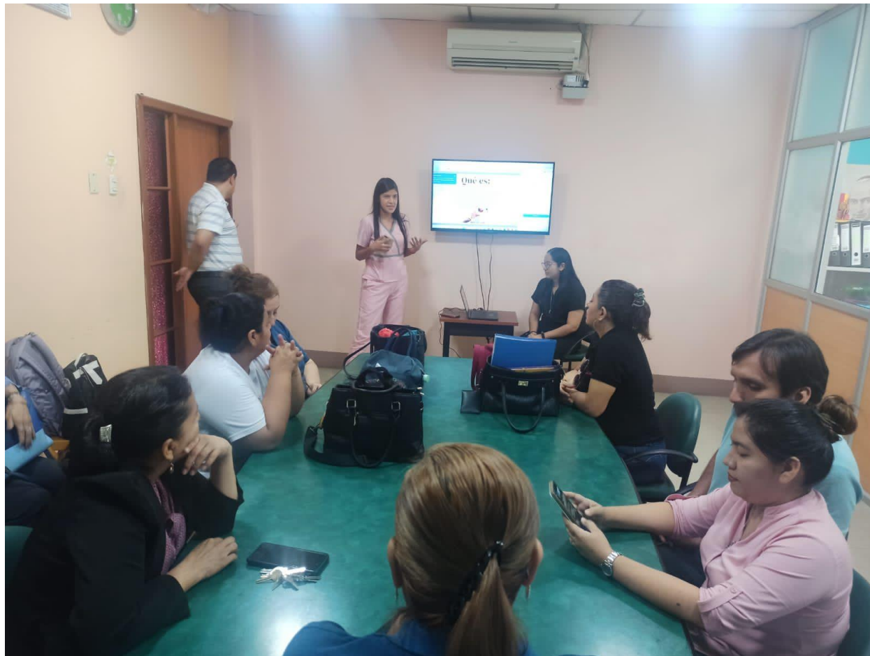
Figura 1. Entrevista con Docentes - Explorando el Fenómeno del Cutting en Estudiantes

En esta toma captamos el momento en que realizamos una entrevista en profundidad a los docentes, en busca de una comprensión más completa de este fenómeno, donde investigamos las causas y los efectos del comportamiento "cutting" de los estudiantes.