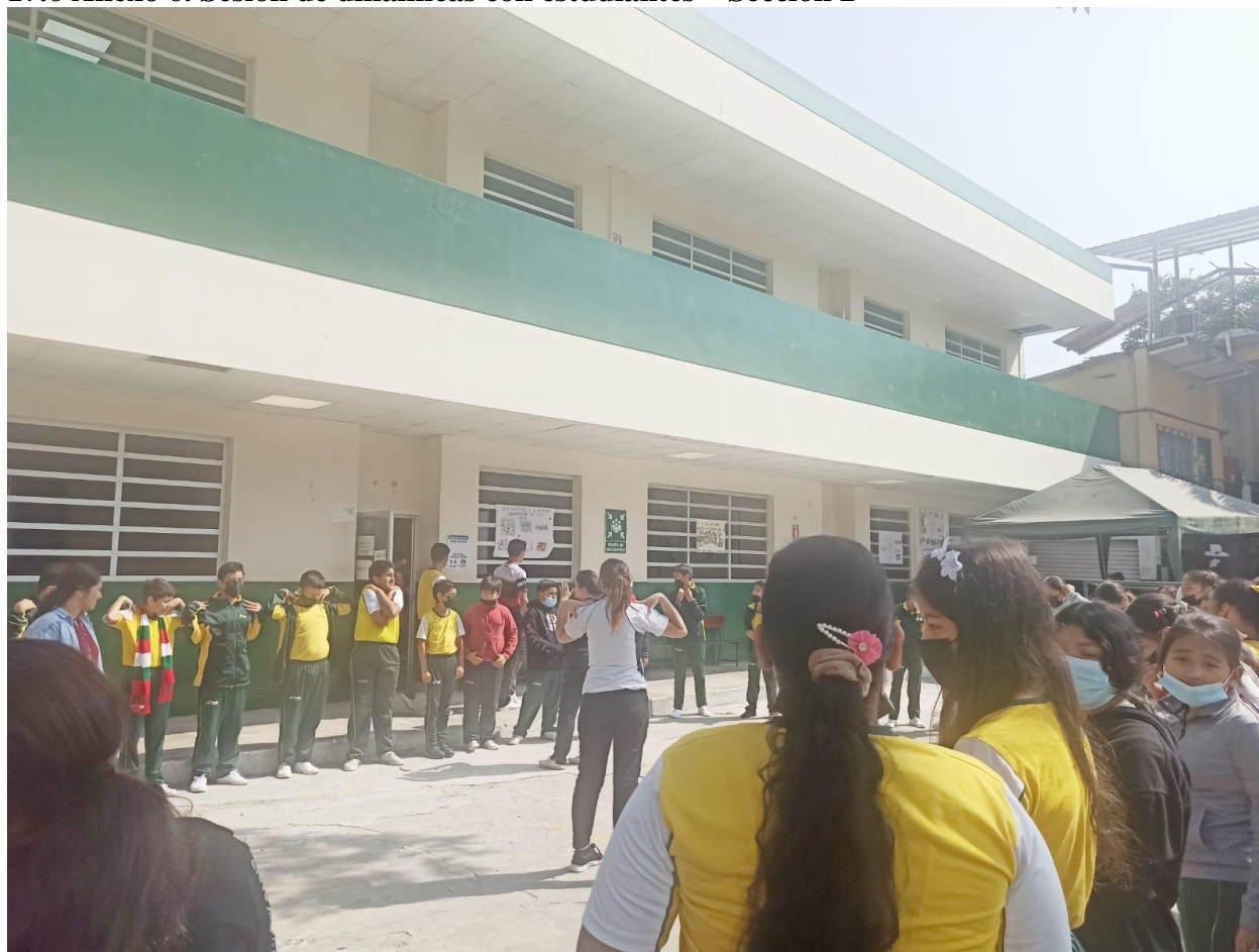
Figura 6. Sesión de dinámicas con estudiantes Sección 2