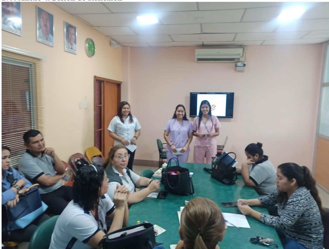
Figura 4. Sesión de Reflexión - Considerando Enfoques Holísticos para la Prevención

En esta fotografía, observamos a un grupo de docentes en una sesión de reflexión. Están considerando enfoques holísticos para la prevención del "cutting" en los estudiantes, incluyendo aspectos emocionales, sociales y académicos.