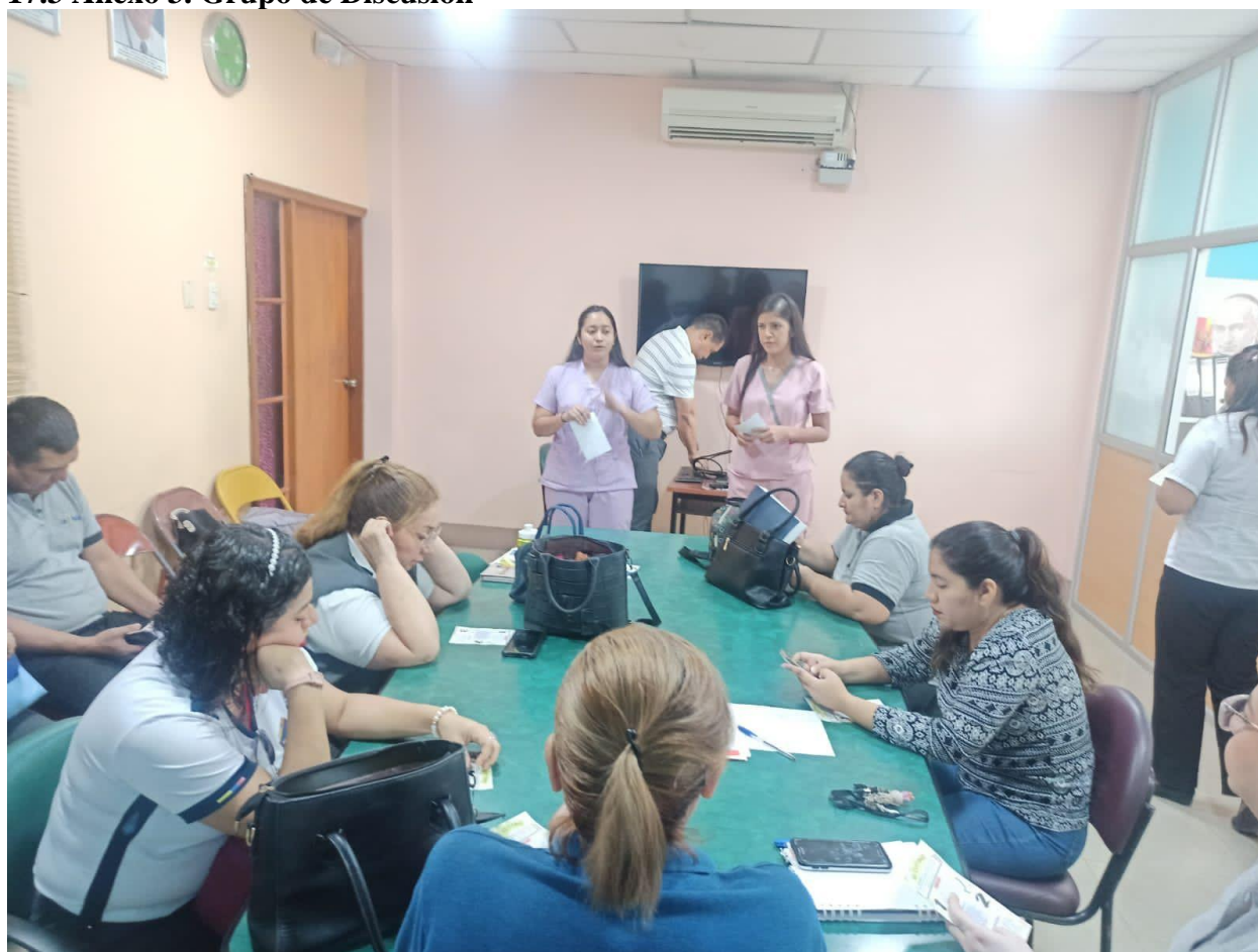
Figura 3. Grupo de Discusión - Estrategias de Intervención para el Cutting en Estudiantes

En esta imagen, podemos ver a un grupo de docentes involucrados en un grupo de discusión centrado en la búsqueda de estrategias de intervención efectivas para abordar el problema del "cutting" en el entorno estudiantil, para luego realizar el intercambio de ideas.