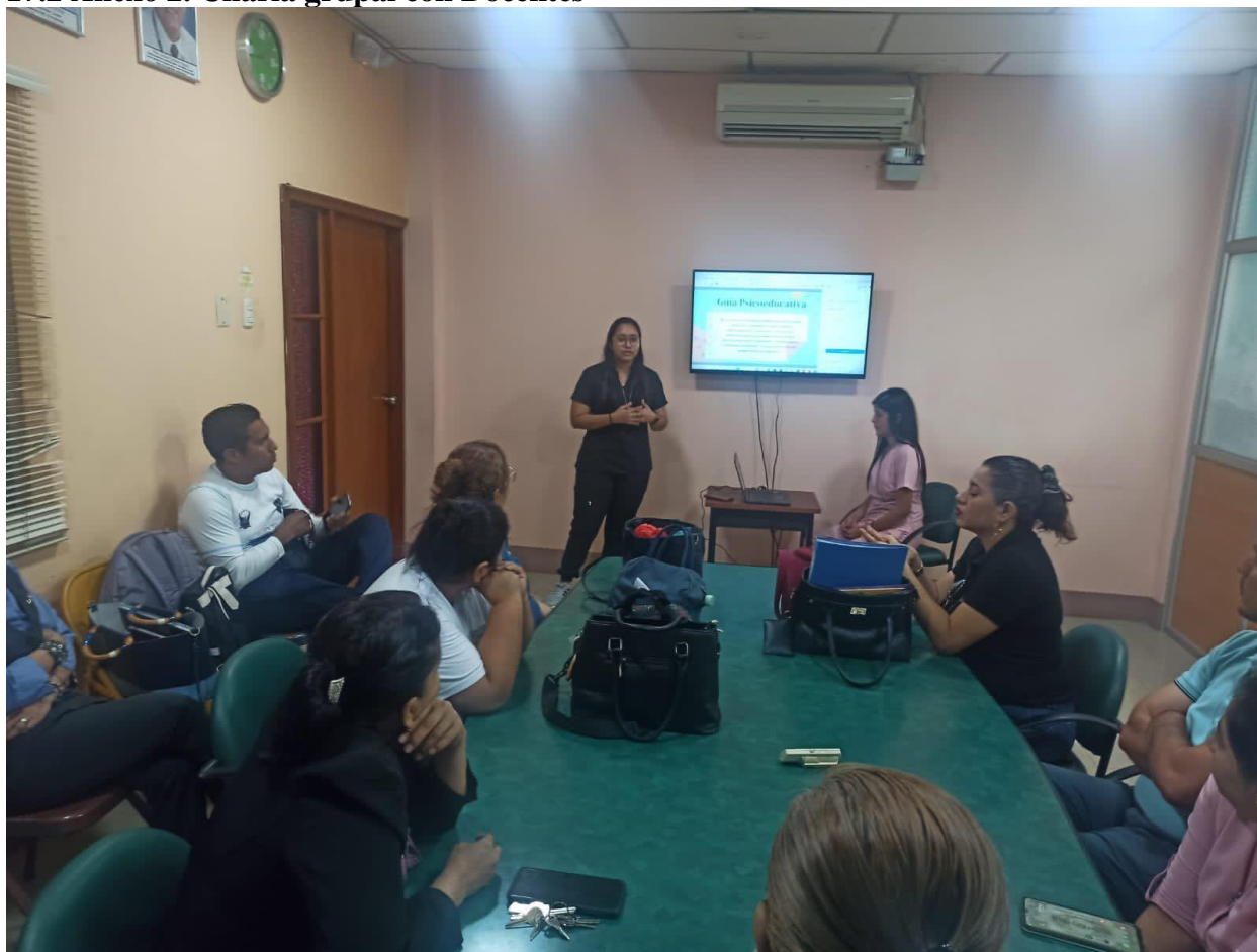
Figura 2. Charla Grupal con Docentes - Identificando Señales de Alerta del Cutting

La fotografía refleja una sesión de charla grupal, en la que varios docentes están comprometidos en una discusión animada, están compartiendo sus observaciones y experiencias en la identificación de las señales de alerta del "cutting" entre los estudiantes, con el objetivo de mejorar la detección temprana y el apoyo.