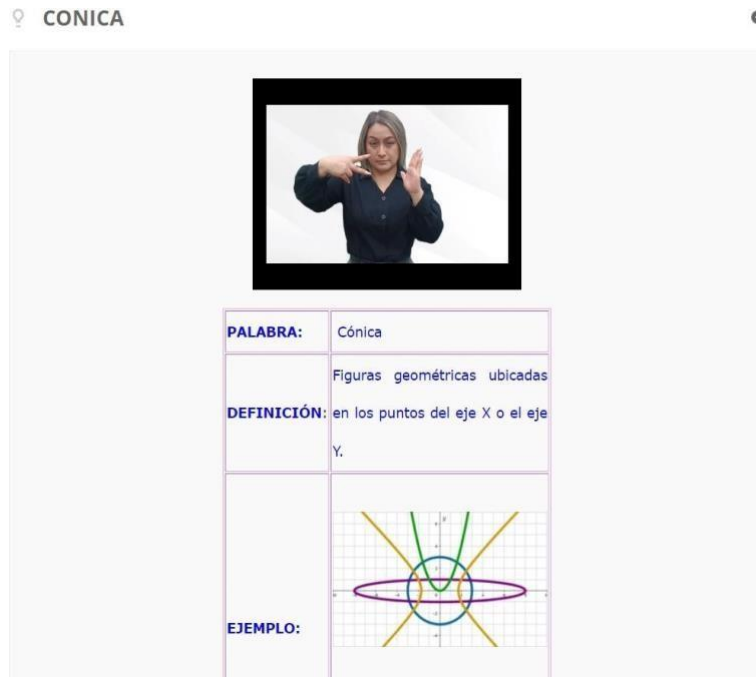
Figura 1. Objeto virtual de aprendizaje