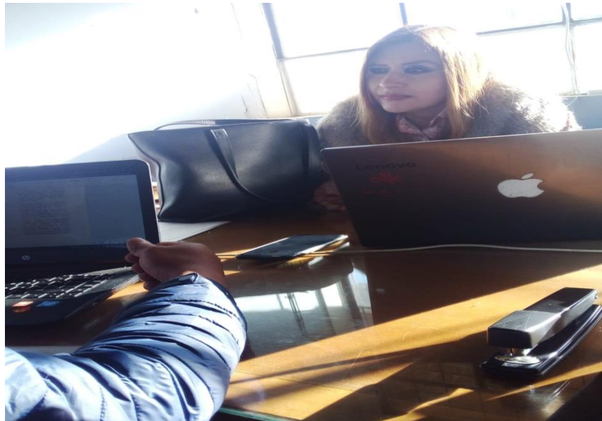
Anexo 1.