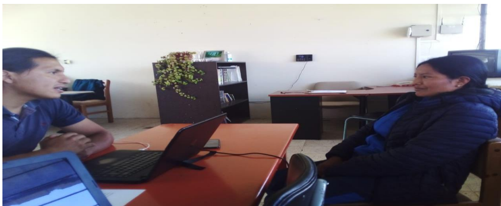
Anexo. 3 fotografía tomada por Blanca Chiza.