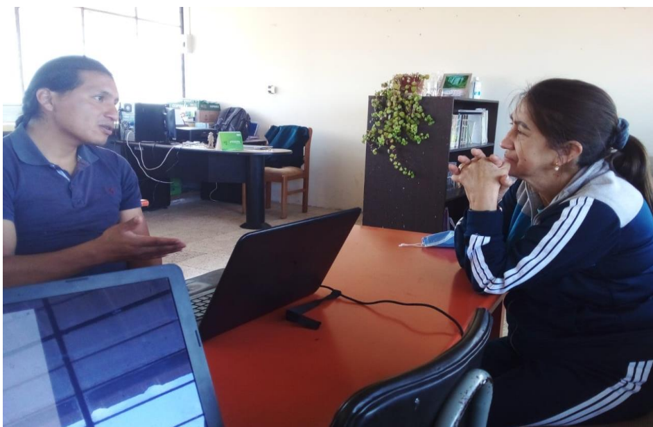
Anexo 2.