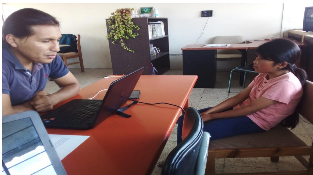
Anexo. 4 fotografía tomada por Blanca Chiza.