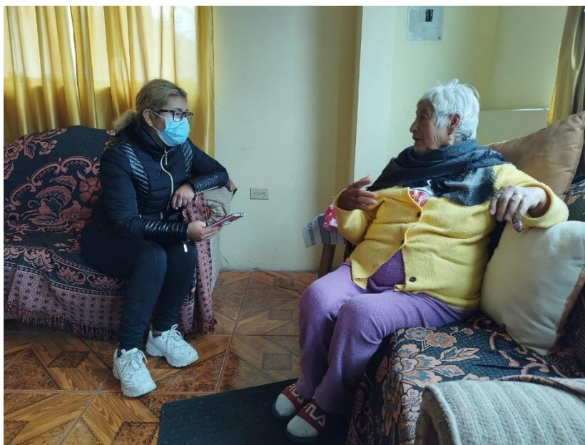
Autora: Jocelyne Moyón, 2022