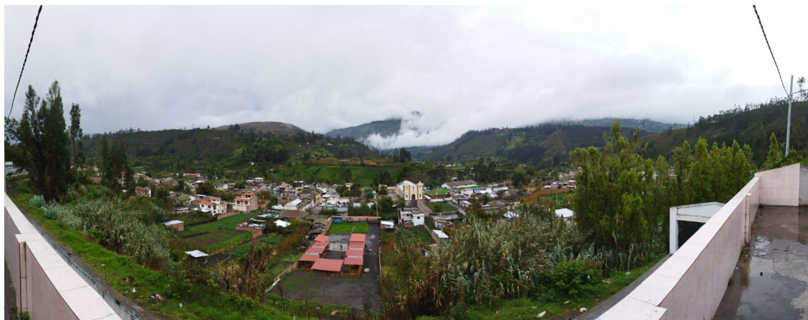
Figura 3: Panorama general de la parroquia de Cubijies, desde el cementerio.

descripciones que mencionaban las personas entrevistadas, quienes guiaban para tener una idea más clara de la ruta trazada.