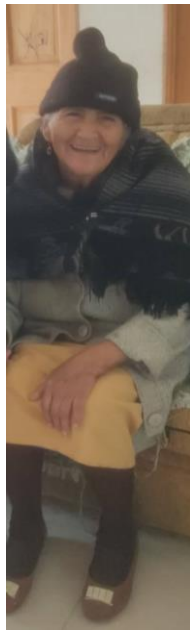
Autora: Jocelyne Moyón, 2022