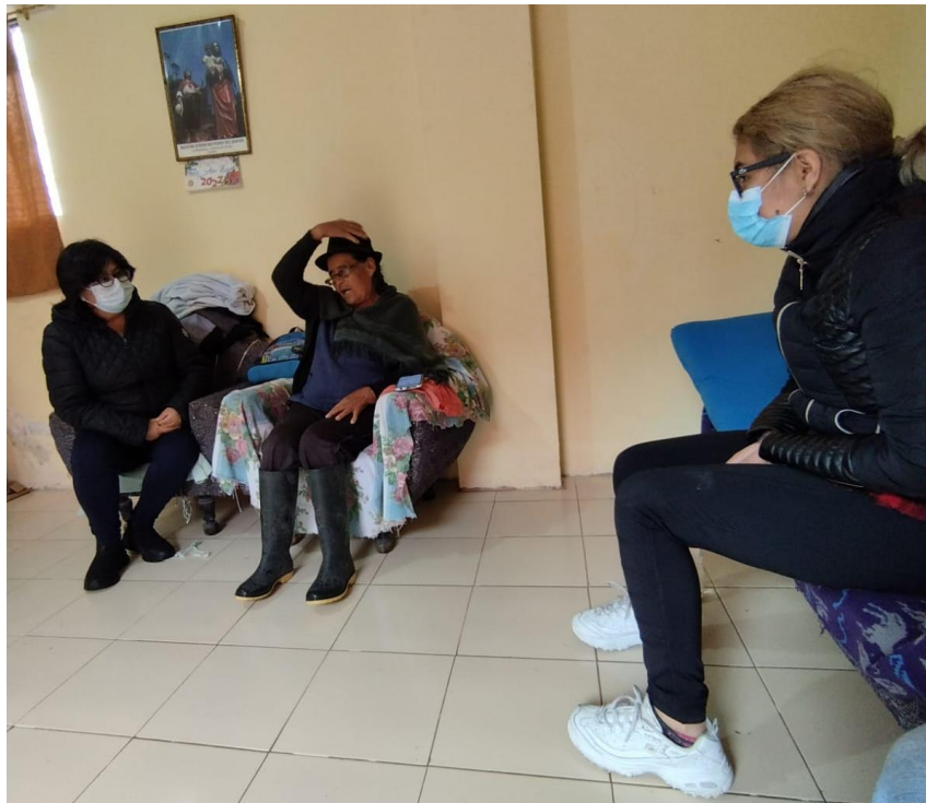
Autora: Jocelyne Moyón, 2022