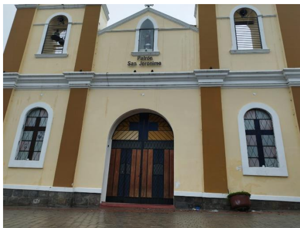
Figura 5: Iglesia de Cubijíes.