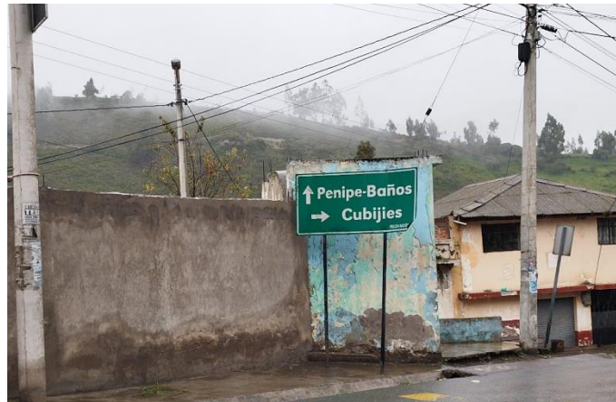
Figura 1: Entrada a la parroquia de Cubijies

En primera instancia se programó ir personalmente al lugar y poder realizar entrevistas a personas que aporten información importante a este trabajo.