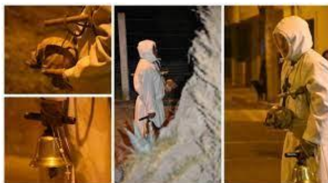
Figura 2: Vestimenta y artículos que utiliza el Animero

“El Animero se viste con una túnica larga blanca con capucha del mismo color, carga en una mano un rosario y una calavera, esta última ya está bendecida por el curita, la misma tiene años siendo utilizada, pues no recordamos desde cuando se obtuvo la calavera, se tiene claro que tiene más de cien años, lo que sí, como es utilizada para una buena acción, permanece intacta. En la otra mano sostiene un látigo y una campana y en su pecho cuelga un gran crucifijo “(Negrete A., 2022).