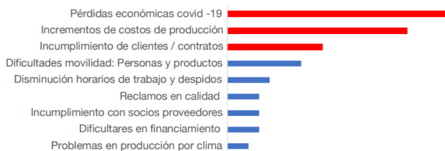
Figura 1 Principales afectaciones en los exportadores EPS

Fuente: Ministerio de Producción, Comercio Exterior, Inversiones y Pesca (MPCEIP) Elaborado por: Autores 2020