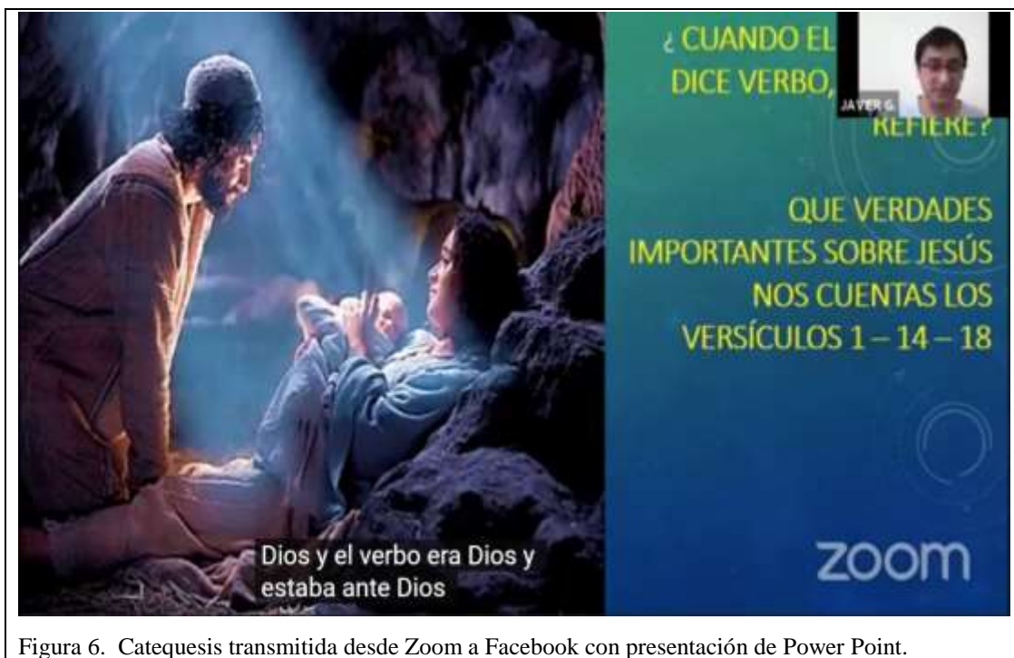
Figura 6. Catequesis transmitida desde Zoom a Facebook con presentación de Power Point.

De estas experiencias presentadas se puede aserir que utilizar a la TAR como aproximación analítica alternativa resulta recio para analizar las variadas entidades técnicas y humanas quienes actúan en la práctica y las diversas conexiones que entre ellas se originan para obtener las explicaciones (Candela, Naranjo, de la Riva, Moreno, & Rey, 2020) respecto a un tema en una aula virtual.