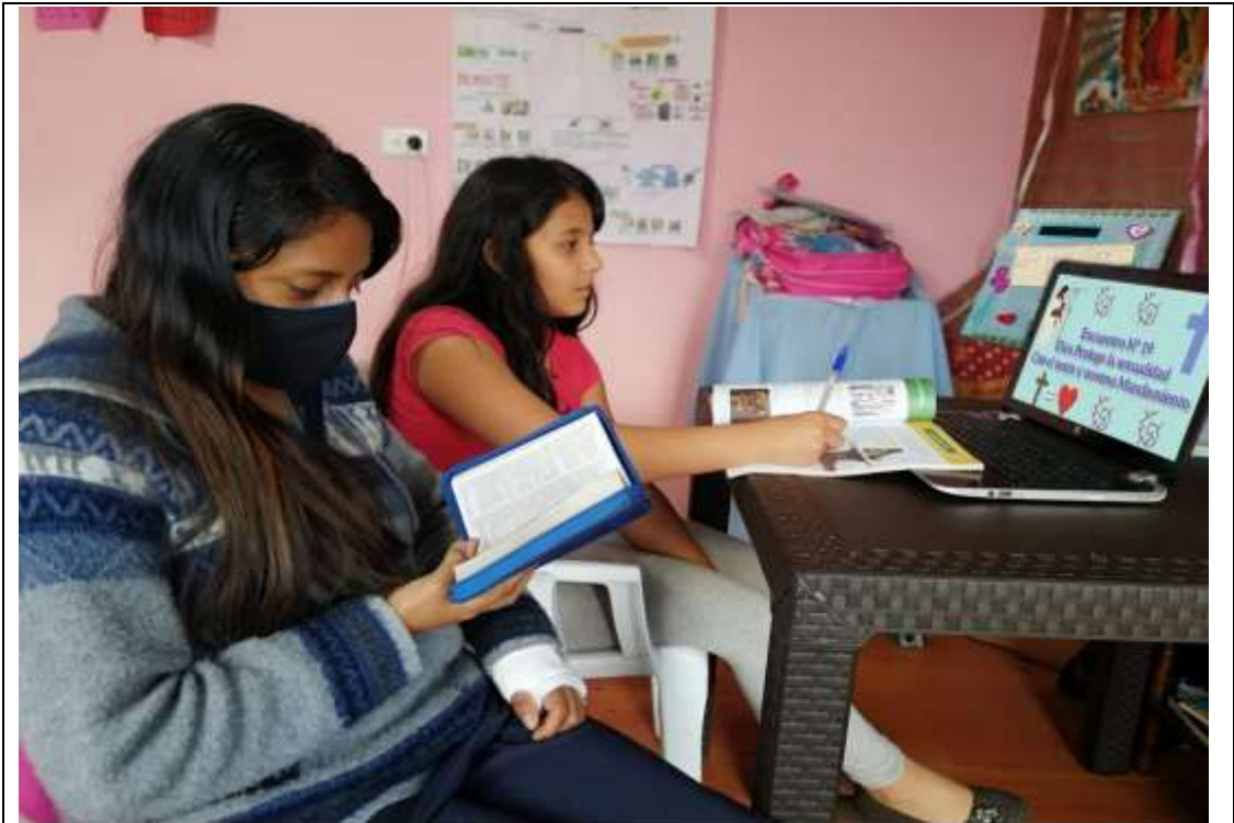
Figura 9. La niña en clase de catequesis acompañada de su hermana