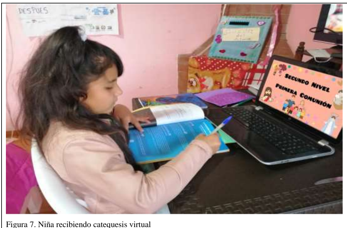
Figura 7. Niña recibiendo catequesis virtual

En la actualidad no es de sorprenderse que los niños manejen mejor la tecnología que un adulto, lo que en ellos se analizará es, cómo es su relación e interacción en un aula virtual de catequesis y la cadena de traducciones que se lleva a cabo respecto del tema que se imparte y se recibe.