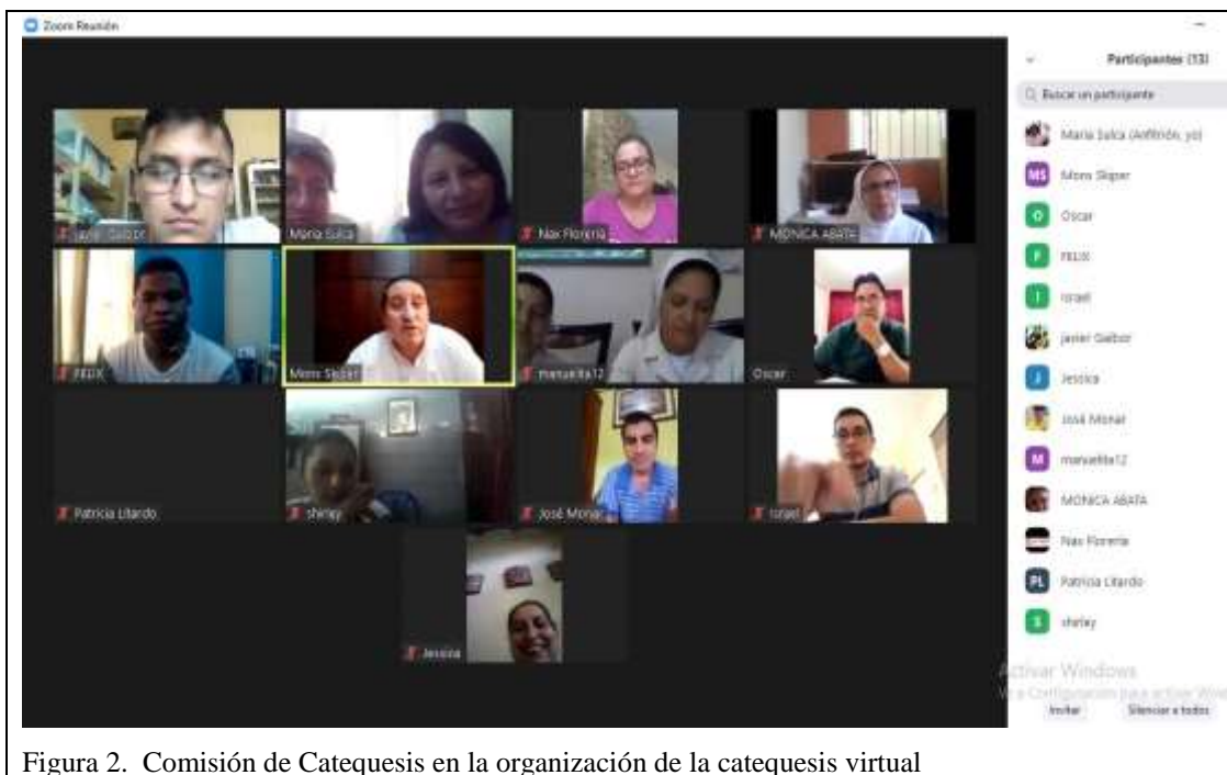
Figura 2. Comisión de Catequesis en la organización de la catequesis virtual

De esta manera se asumió lo que en el Directorio para la Catequesis dice respecto a la tecnología y las redes “las tecnologías de redes modernas son interesantes y útiles porque permiten la interacción” (Valenzuela Magaña, 2021, p. 86). Aunque en este mismo documento, unos párrafos antes digan que: lo virtual no puede reemplazar la realidad espiritual, sacramental y eclesial pues para ser testimonio del Evangelio es preciso una genuina comunicación cara a cara entre las personas (Valenzuela Magaña, 2021). Sin duda que esto se debe corregir ya que la catequesis virtual al parecer se quedará por un buen tiempo, frente a ello unos dirán que la catequesis virtual es tan real como si se la estuviese realizando en un aula parroquial, mientras que otros opinan que la catequesis virtual no será equivalente pues sus resultados son muy limitados.