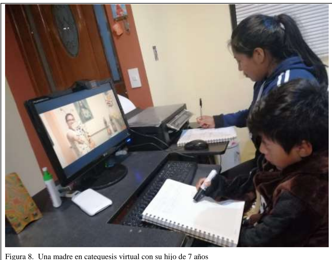
Figura 8. Una madre en catequesis virtual con su hijo de 7 años

La presencia de un adulto (mamá o papá) es importante en la formación de los niños ya que éstos pueden ayudar a comprender y a hacer uso de las herramientas y objetos de enseñanza; su ayuda permite al niño alcanzar un objetivo. En el caso de los más pequeños, las personas adultas demuestran como llevar a cabo una actividad y el