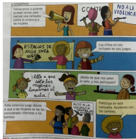
“ Campaña en contra de la violencia ”

Nota. Texto escolar de Lengua y Literatura de 6to año de EGB. Unidad 4. (MinEduc, 2018, p. 116).