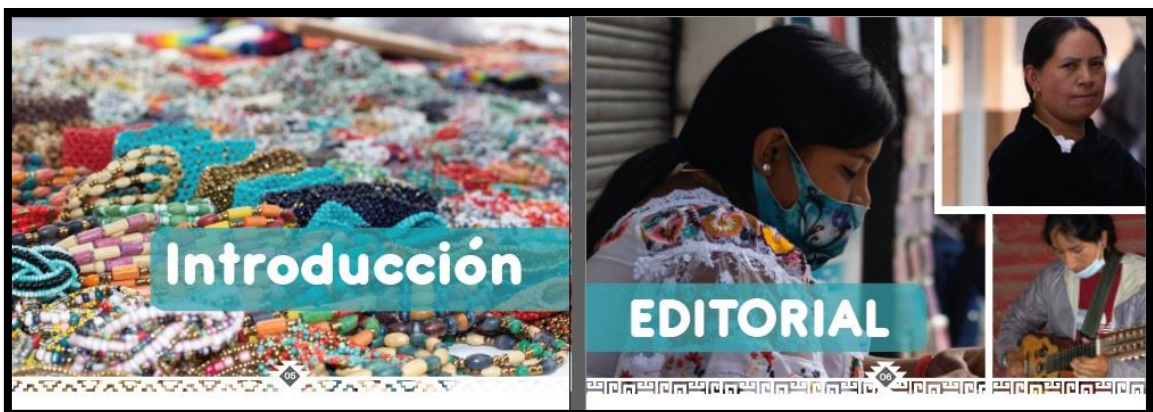
Introducción – Editorial