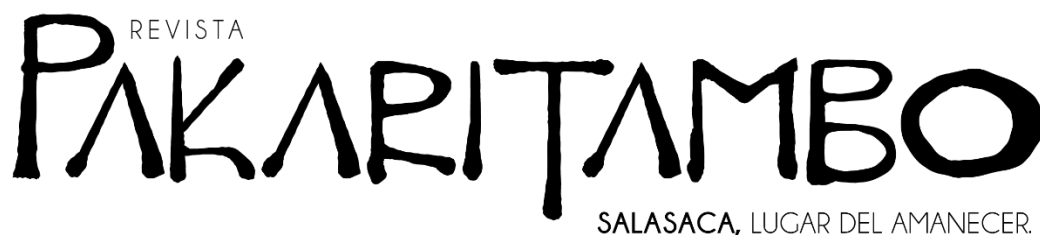
Imagen 1. Logotipo, opción 2

Para la selección del logotipo se hizo una encuesta a diferentes personas sin ningún rango de edad, yendo desde los 17 a los 55. Al concluir la encuesta el 60,7% de los encuestados eligió la tipografía de la opción n°1, dando por decidido la primera opción como tipografía para el logotipo de la revista digital.