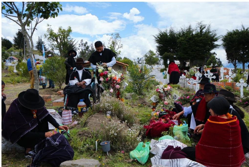
Imagen 4. Cementerio de Salasaca, celebración del día de los difuntos

Para la elaboración de la revista fueron fundamental las fotografías, se obtuvieron 150 fotografías, 30 de ellas fueron cedidas por el Sr. Rumiñawi Masaquiza. Se tomaron en formato Raw y se editaron en Adobe Photoshop. Parte de las fotografías muestran algunos de los eventos como: Carnaval, El día de los difuntos, entre otras ceremonias.