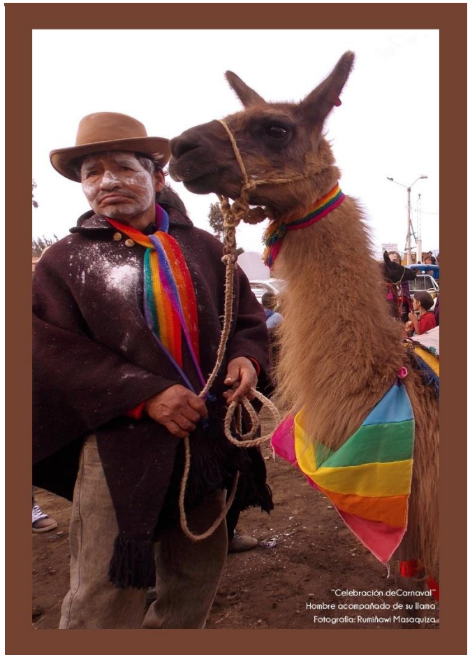
Imagen 6. Contenido de la revista (Tradiciones-Carnaval)