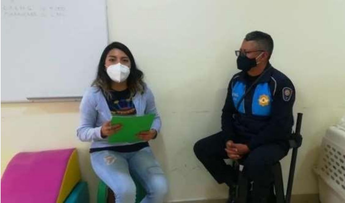
Anexo 1. Entrevista al Agente Metropolitano