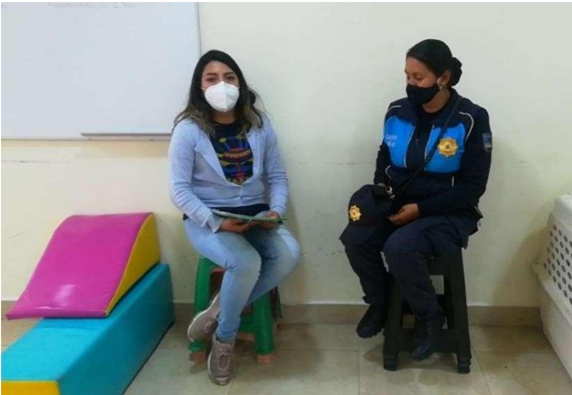
Anexo 2. Entrevista al Agente Metropolitano