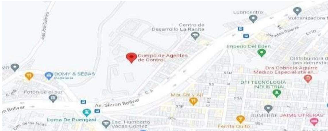
Figura 1. Ubicación de la Cuerpo de Agentes de Control Metropolitano de Quito

El proyecto de intervención se realizará en la Provincia de Pichincha y en el cantón Quito, en el Cuerpo de Agentes de Control Metropolitano de Quito que se encuentra ubicado en la calle Juan Bautista Aguirre, Barrio Las Mallas, sector Loma de Puengasí, y Av. Libertador Simón Bolívar.