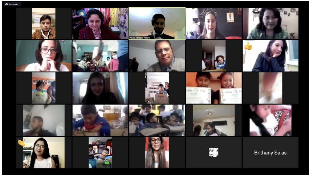
Figure 1