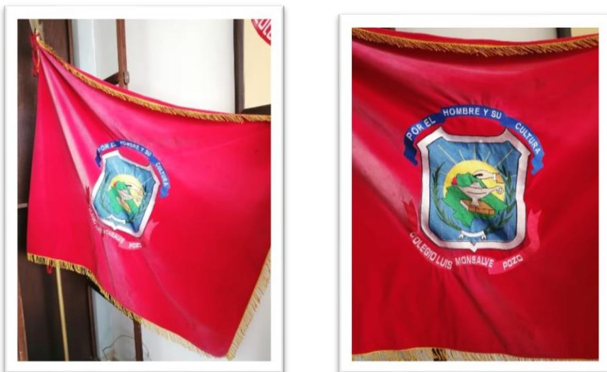
Imagen 3. Bandera original de la Intitución que reposa en rectorado.