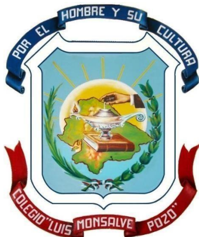
Imagen 2. Escudo de la UELMP