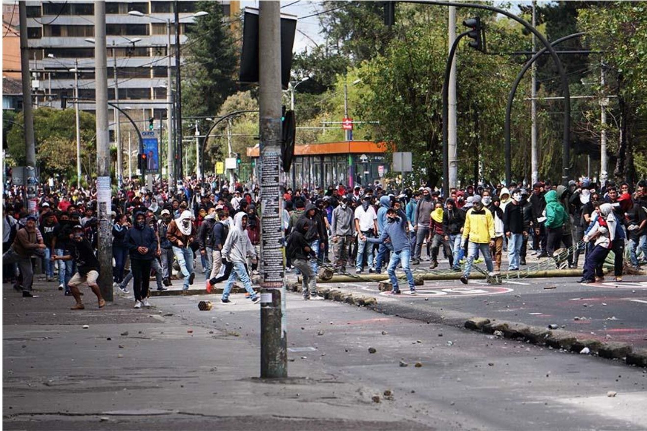
Pie de Foto: Manifestantes se dirigen desde la Caja del Seguro, en la Avenida Amazonas, hacia el Centro Histórico de Quito.