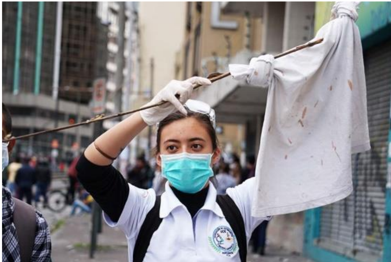
Pie de Foto: Una estudiante de la Universidad Central del Ecuador lleva una bandera blanca para distinguirse entre los manifestantes y ayudar a los heridos.