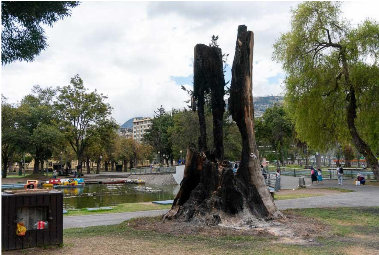
Pie de Foto: En un informe preliminar, la Secretaría de Ambiente de Quito informó que cerca de 5 mil árboles fueron afectados durante las protestas. En la imagen los restos carbonizados de un bicentenario tronco de ciprés es lo que ahora adorna al parque La Alameda. A su lado plantaron un pequeño nogal, que fue bautizado por el alcalde Jorge Yunda como el árbol de la reconciliación.