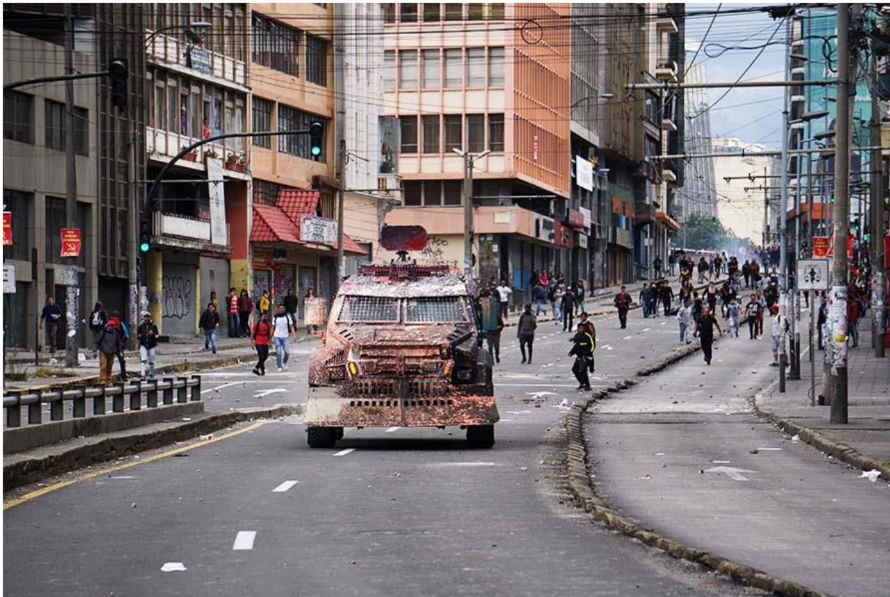
Pie de Foto: Varios manifestantes lanzaron pintura a uno de los carros blindados de la Policía.