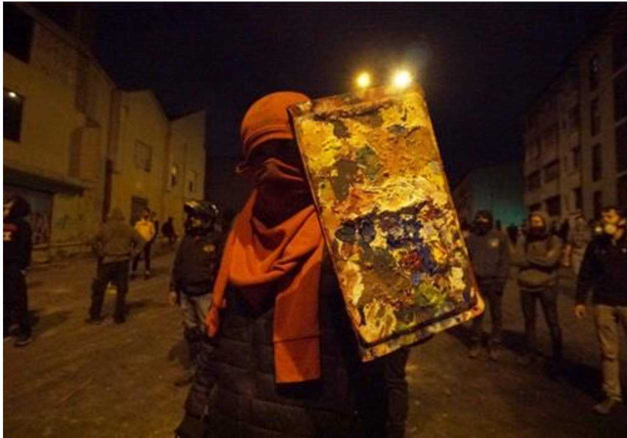
Pie de Foto: Un manifestante muestra la lata donde mezclaba pinturas. Segundos después la utilizaría para cubrirse de los disparos policiales.