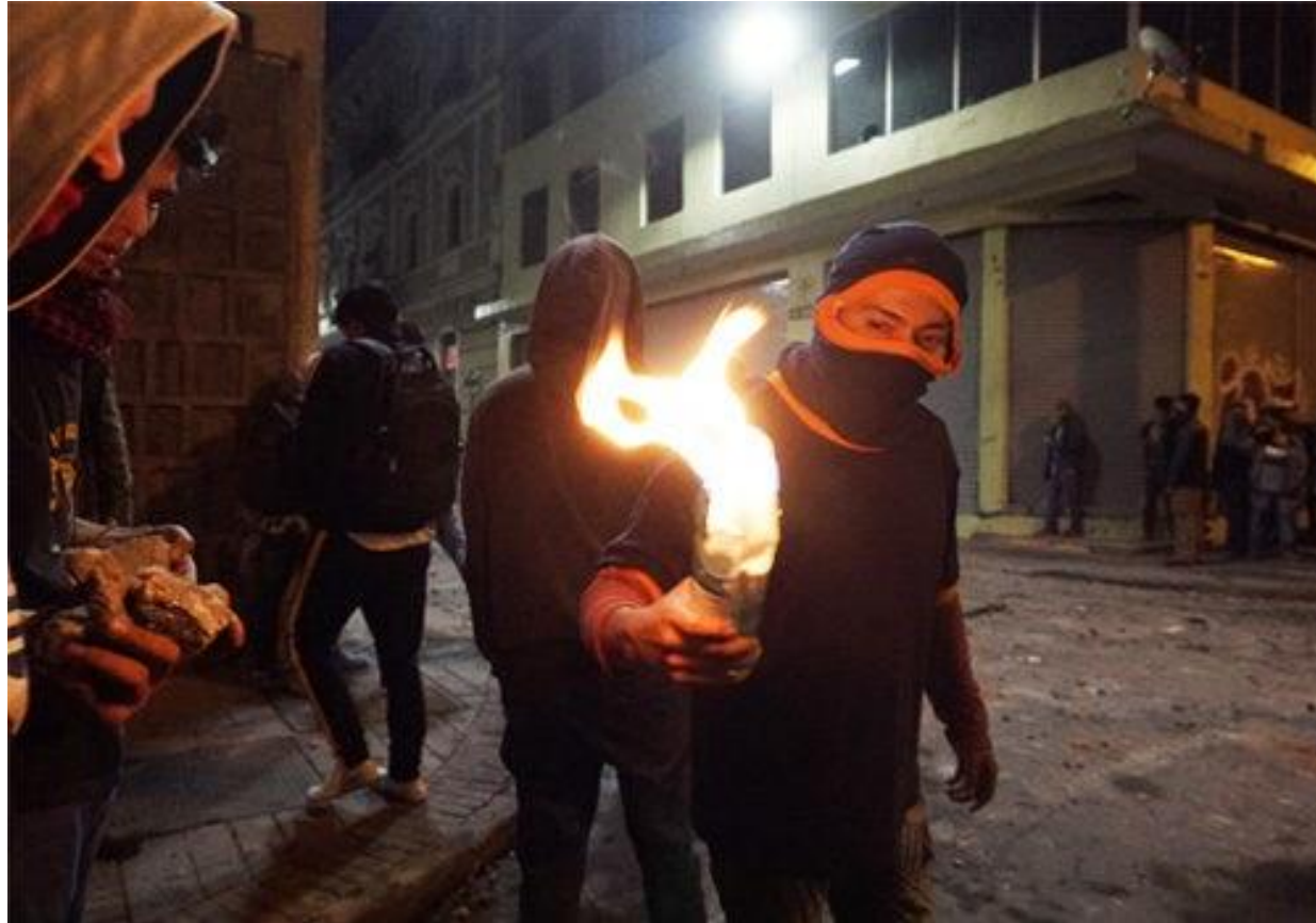
Pie de Foto: Varios manifestantes gritaban en las calles. El uso de botellas de vidrio y tela sirvieron para armar bombas molotov.