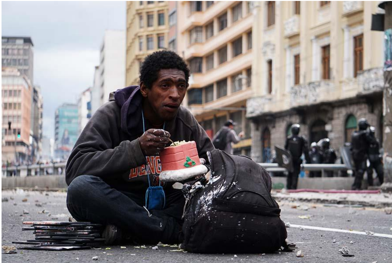
Pie de Foto: Un vendedor de películas, mira de frente como los manifestantes lanzan piedras.