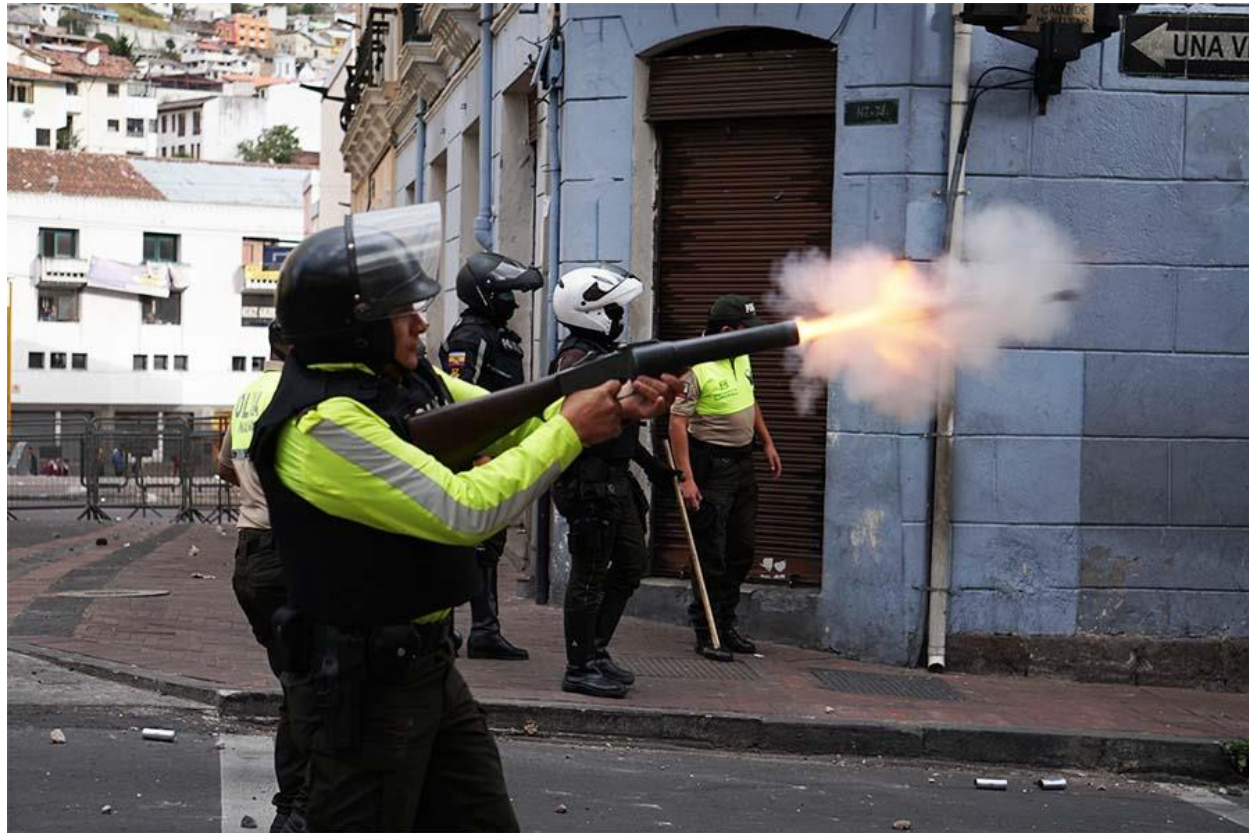
Pie de Foto: Un miembro de la Policía dispara bombas de gas lacrimógeno en dirección a los manifestantes.