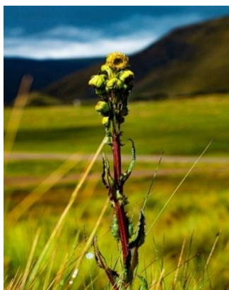
Flor en páramo de Papallacta.