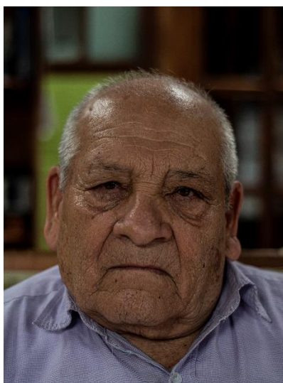
Jacinto Pinto personaje histórico de Quijos.

Para fotografías de los personajes históricos y aumentar rasgos como expresiones, mirada, arrugas de la piel etc, se utilizaron programas de edición.