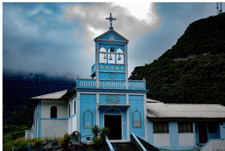
Infraestructura arquitectónica, Iglesia parroquial Papallacta.