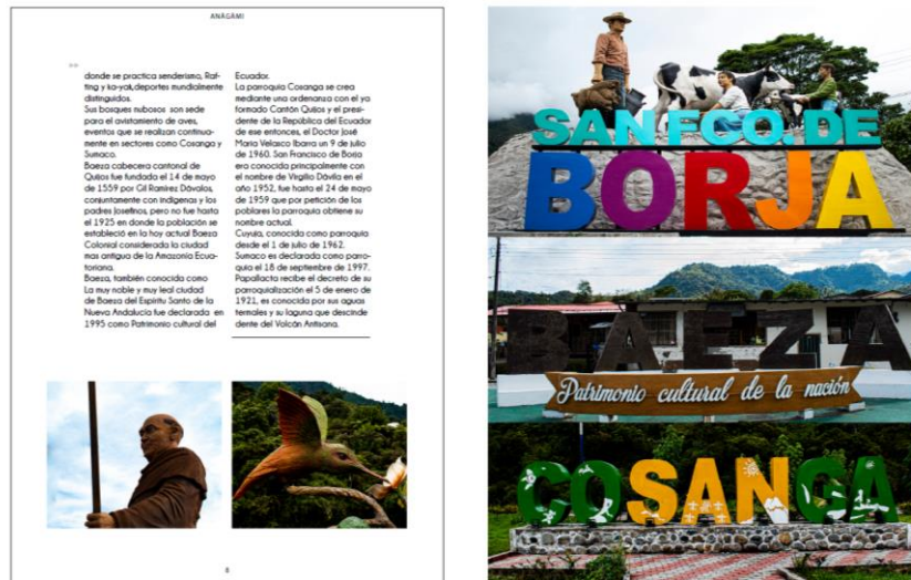
Sección de revista digital, Elaborado por Jorge Coloma Pinto

Cada una de las fotografías representan nombres y monumentos importantes del Cantón Quijos.