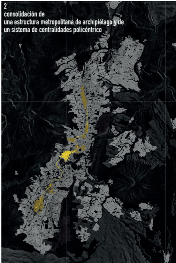
Mapa 2 Sistema policéntrico