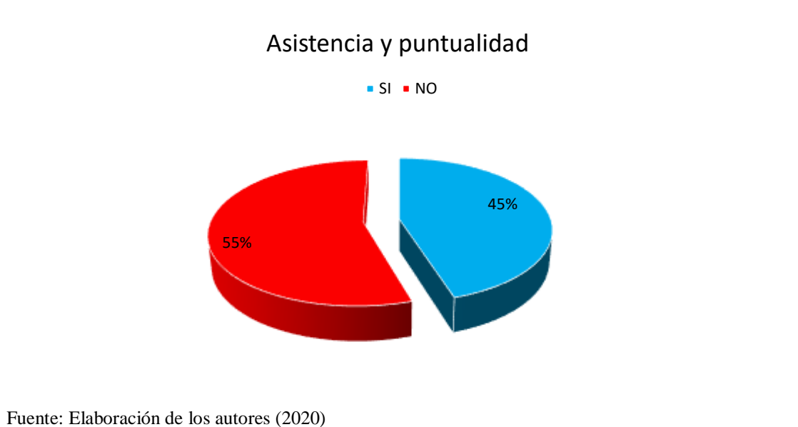
Figura 2. Asistencia y puntualidad

Entre otras causas para que se presenten los atrasos y las inasistencias en los estudiantes se identifican dos factores: el contexto familiar que transmite el desinterés y baja importancia por la educación; y el nivel económico como un factor que predomina en las familias, por lo que interfiere en el cumplimiento responsable de las normas del código de convivencia institucional.