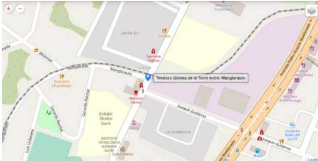
Figura 1. Localización

Ubicación geográfica de la Unidad Educativa Fiscomisional “San Patricio”, Quito – Ecuador.