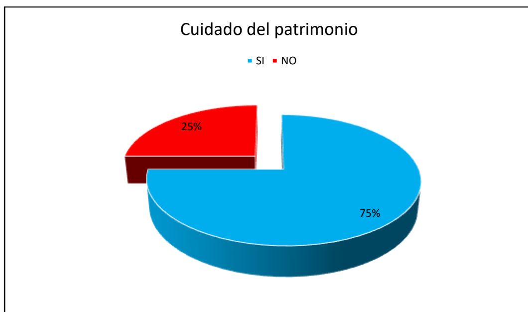
Figura 4. Cuidado del patrimonio