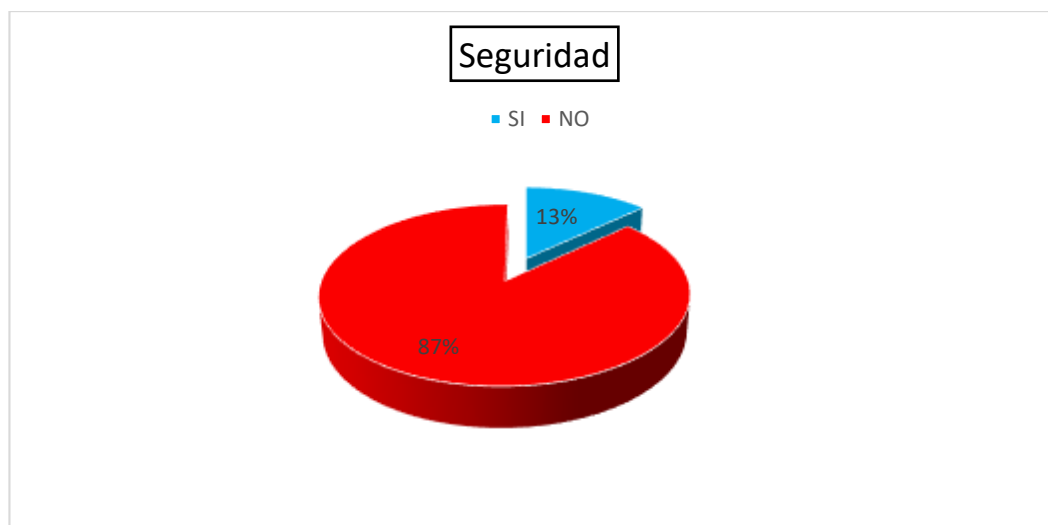
Figura 5. Seguridad