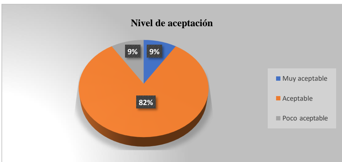
Figura 3. El nivel de aceptación que tiene el texto escolar, por B. Checa, 2020

Tal como se observa en el gráfico de la tercera pregunta, el 9 % de los padres o madres de familia consideran que el nivel de aceptación del texto escolar “Talento” de Estudios Sociales es muy aceptable. El 82 % de los tutores aceptan el texto escolar. Y, el 9 % de ellos aceptan poco el texto escolar.