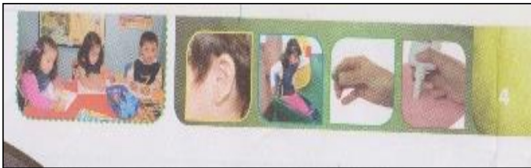
Figura 2 Uso de Iconos de destrezas en el texto

En las siguientes imágenes se puede visualizar el formato que tiene cada una de las láminas de trabajo del texto escolar.