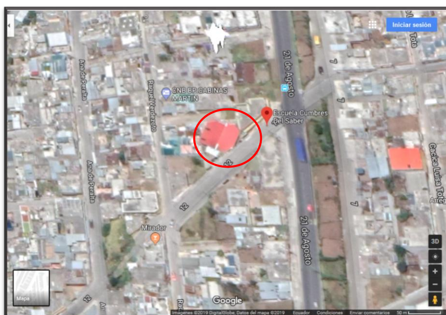
Figura 1 Ubicación Institución Educativa "Cumbres del Saber"

La institución “Cumbres del Saber” está ubicada geográficamente en el Ecuador, en la provincia de Pichincha, en el sector Sur del cantón Quito, en las calles AV. Veinte y Uno de Agosto - ESQ E6-271 - S 27 y D en el barrio “Lucha de los Pobres”