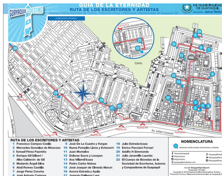
Ilustración 3-Guía de la Eternidad, Cementerio General de Guayaquil,

Ruta de los escritores y artistas: Grandes escritores, historiadores, periodistas y compositores de Guayaquil, el aporte que ellos brindaron a través del arte, la escultura, la pintura, y el periodismo, hizo que la cultura de la ciudad crezca cada vez más.