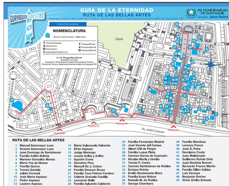
Ilustración 4-Guía de la Eternidad, Cementerio General de Guayaquil,

Ruta de la Bella Arte: Esta es arte del Cementerio General de Guayaquil más atractiva para los turistas, por la belleza, forma y calidad estética de sus tumbas, cuyos creadores corresponde a destacados artistas de Europa y de nuestro país. A sus costados se observa una magnífica estatuaria, llena de simbolismo y de frases que testimonian el cariño por los seres queridos o seguidores.