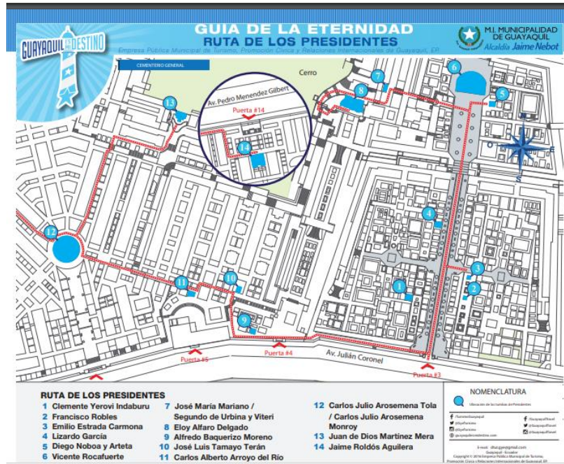
Ilustración 2-Guía de la Eternidad, Cementerio General de Guayaquil,

Rutas de los Presidentes: Descansan los presidentes del país, entre ellos, primer presidente ecuatoriano Vicente Rocafuerte; Diego Noboa y Arteta, integrante del Triunvirato que derrocó a Juan José Flores, Jaime Roldós Aguilera, quien tuvo una muerte trágica, entre otros que lucharon por mejorar el país.