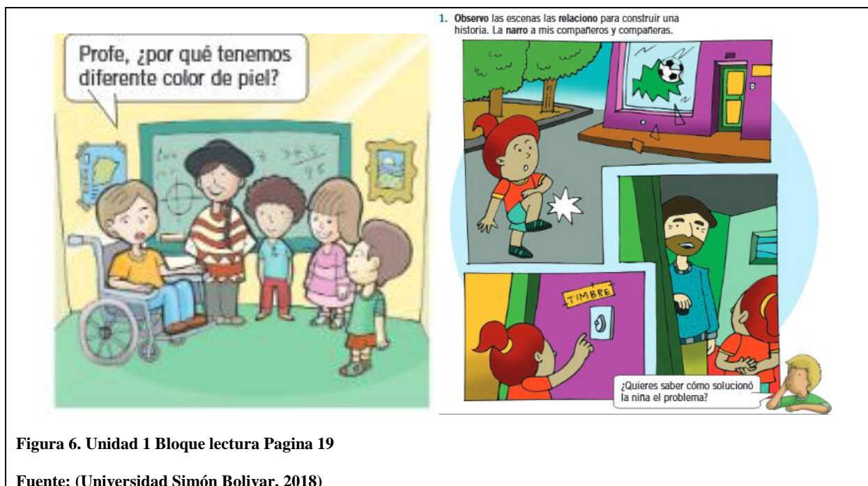
Figura 6. Unidad 1 Bloque lectura Pagina 19

Además es también un material no sexista, al utilizar un lenguaje que no promueve el machismo o cualquier forma de discriminación por género. Esto se evidencia en imágenes e ilustraciones como por ejemplo: