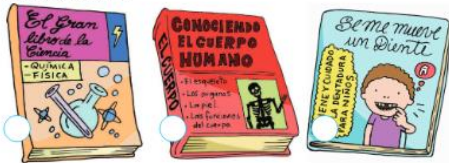
Figura 4. Unidad 1 Bloque lectura Página 19

Es importante indicar que los contenidos no son tratados con la misma importancia, ya que se puede observar que al bloque curricular Lectura es al que se le toma más atención que al bloque Comunicación Oral.