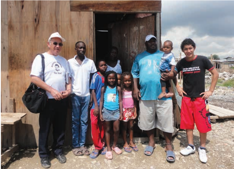
Figura 19 Primeras visitas al Barrio Nigeria, año 2011