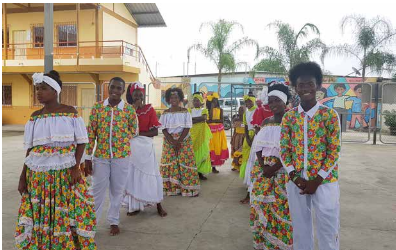
Figura 11 El afroecuatoriano del barrio Nigeria

(...) Desde niño, uno lo vivió. En mi escuela éramos 2 o 3 personas afrodescendiente, y se escuchaba frases de los maestros como: merienda de negros, a pesar de que mi profesora era negra. (C. Valencia, comunicación personal, 20 de febrero 2016)