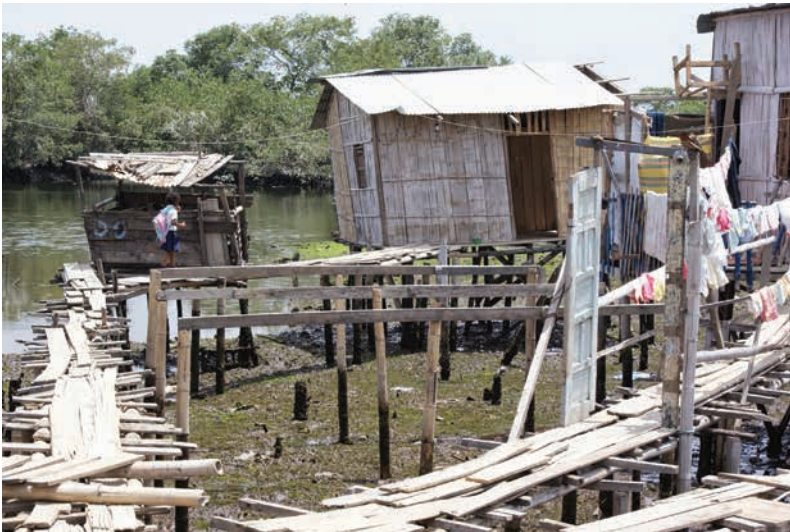
Figura 5 Infraestructura del barrio Nigeria en sus inicios

En la Figura 8, se refleja aquella realidad contada por las diferentes personas que forman parte de los datos de la investigación, que recuerdan aquella situación en la que vivían, sobre todo el conjunto de circunstancias de peligro a la que estaban expuestos. Como se puede evidenciar en el periódico El Universo, con el siguiente titular: “Un incendio deja 30 heridos en un barrio de Nigeria” (2012). Las situaciones más comunes a las que se estaba, y aún se sigue estando expuesto, son: incendios por las condiciones de sus casas, delincuencia que se enquistó en el sector, consumo y expendio de droga, trabajo infantil, etc.