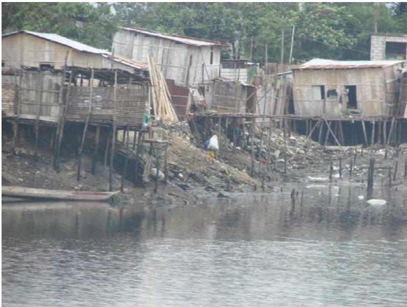
Figura 4 Barrio Nigeria, asentamientos al borde del manglar

(...) yo vivo hace 25 años en el barrio Nigeria. Aquí las cosas eran agua, puente, y vivíamos encima del estero. La marea bajaba y subía, no teníamos agua, no teníamos luz, nos ingeniábamos para poner la luz a expensas de la marea, (P. Prado, comunicación personal, 13 de febrero, 2016)