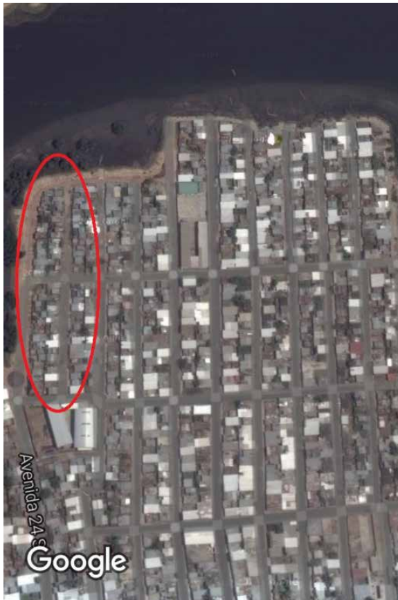
Figura 14 Sector sin servicio de alcantarillado