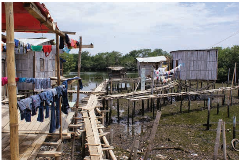
Figura 6 Infraestructura del barrio Nigeria