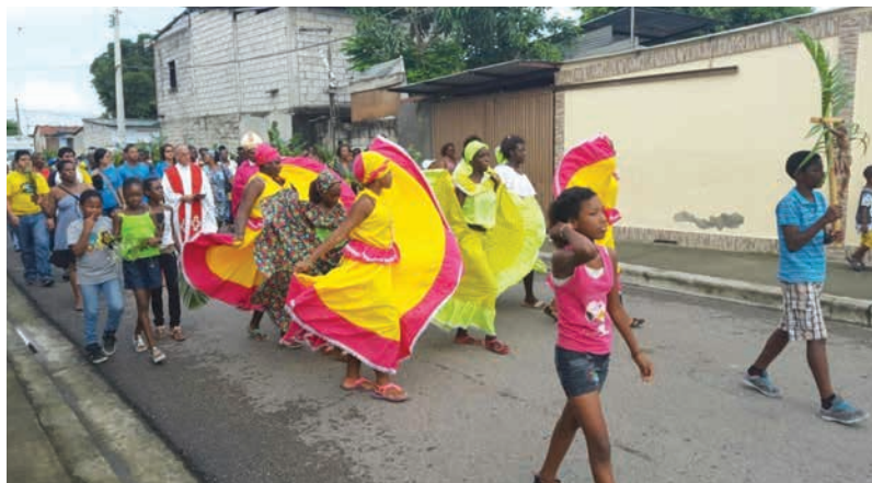
Figura 15 Celebración de Domingo de Ramos

Estos son los componentes que emergen en este trabajo, basado en los afroecuatorianos del barrio Nigeria. A continuación, se hará énfasis en la marimba, que está arraigada en las costumbres de esta comunidad.