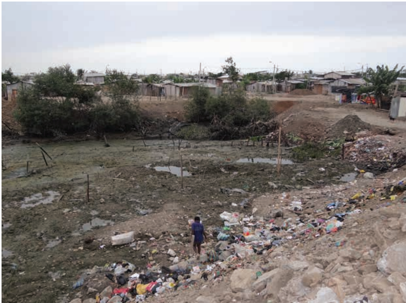
Figura 9 Relleno barrio Nigeria

Esto se da como resultado de su ímpetu por ayudar a otros jóvenes, con la intención de querer formar grupos de liderazgo.