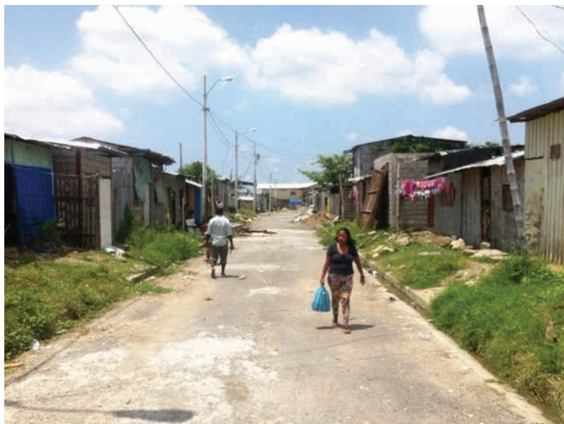
Figura 10 Actualidad del barrio Nigeria