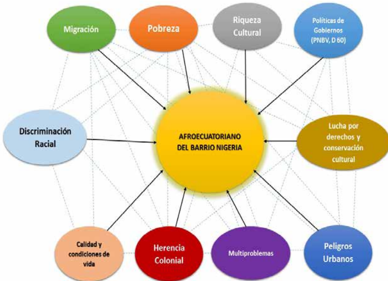
Figura 25 Diagrama del afroecuatoriano del barrio Nigeria

cación intercultural, implementada por el Gobierno del presidente Rafael Correa, preservar no solo las costumbres del pueblo afro, sino de todas las etnias y nacionalidades que conforman la República del Ecuador. Es relevante conocer que ante esta situación cultural Morin (2009) en su obra El Método 5 , indica que la cultura “(...) es fuente generadora/regeneradora de la complejidad de las sociedades humanas” (p. 185). En ese sentido reconoce que se “(...) autoproduce, autoorganiza, autopropetúa” (p. 185) e inclusive se autoregenera gracias a los mitos, reglas, normas, etc. En relación con el barrio Nigeria, se ha podido evidenciar aquello que propone Morin (2009), pues este sistema entretejido enriquecido culturalmente sobrevive ante influencias de iniciativas internas, como externas.