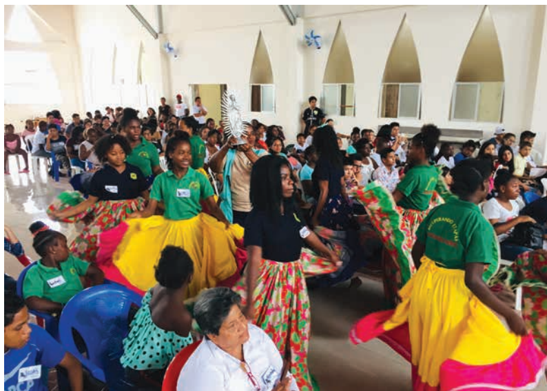
Figura 18 Baile de marimba y costumbres religiosas

En la ciudad, es donde comienzan otros tipos de fenómenos basados en esta circularidad del paradigma de “ser pobre, por ser afro”. Aunque, se está consciente que existe lo que Aldaz y Morán (2001) llaman “la transmisión de la pobreza”, en la que exponen, que en la mayoría de los casos la pobreza se hereda por conjuntos de factores en la familia, que son el resultado de la desigualdad social, como por ejemplo la escolaridad baja de los padres y los ingresos bajos (Aldaz & Morán, 2001). De una u otra manera el Ecuador ha tenido durante mucho tiempo aquella brecha social en la que pocos podían acceder a becas y estudios de calidad, no obstante, esta brecha se ha acortado.