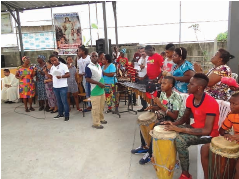
Figura 16 Grupo de Marimba barrio Nigeria

La marimba es un arte de alegría. A veces uno cuando está tranquilo escucha la marimba y se distrae. (B. Valencia, comunicación personal, 22 de marzo 2016)