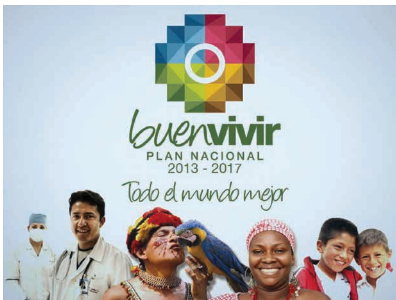
Figura 1 Plan Nacional del Buen Vivir 2013-2017

Cuando el Estado propone auspiciar la igualdad, la cohesión y la equidad social y territorial, en la diversidad; y mejorar la calidad de vida de la población. Hace referencia al cumplimiento de los Objetivos de Desarrollo del Milenio 7 (ODM), planteados por la Organización de las Naciones Unidas (ONU), los cuales buscan resolver problemas calificados como graves en el mundo, entre estos se encuentran: la erradicación de la pobreza extrema y el hambre; promover la igualdad entre los géneros y la autonomía de la mujer; fomentar una asociación mundial para el desarrollo. Es aquí, donde se puede palpar la preocupación del Estado ecuatoriano por buscar mejorar el Buen Vivir de sus ciudadanos.