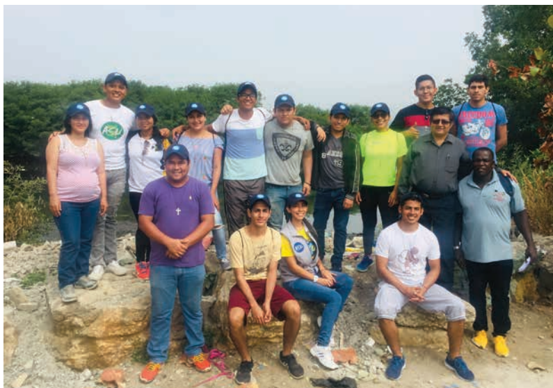
Figura 24 Estudiantes y personal de la UPS, que vivieron la experiencia de intervención en el barrio Nigeria, marzo 2019

Todos estos procesos, han logrado contribuir al Buen Vivir de las personas, pues el sentirse acogidos, acompañados y sobre todo formados en los procesos que se han levantado en los últimos años, aportan al autoestima de los beneficiados, es interesante constatar como la simple presencia de los estudiantes de la UPS les anima a asistir a estos procesos, además, inspira en los más pequeños la perseverancia en la continuidad de estudios de nivel superior, logrando que estos en un futuro puedan mejorar sus condiciones de vida.