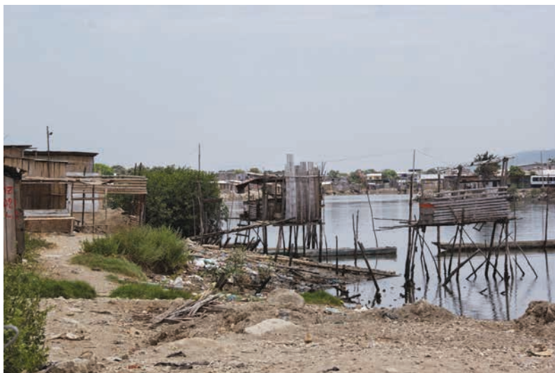
Figura 8 Relleno barrio Nigeria

el alcalde envió a rellenar cuando ya estaba casi la mayoría relleno” (J. Castillo, comunicación personal marzo 25, 2016).