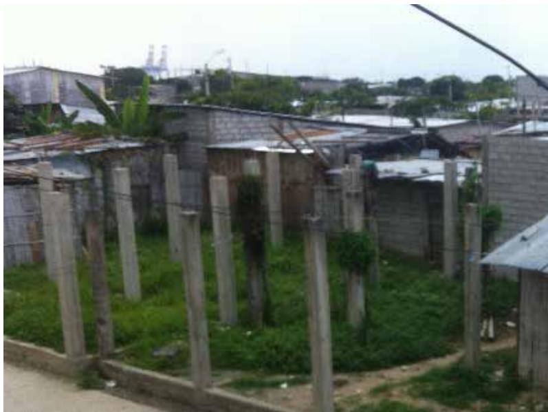
Figura 13 Barrio Nigeria en la actualidad

Elaboración: Juan José Rocha Acceso al agua potable