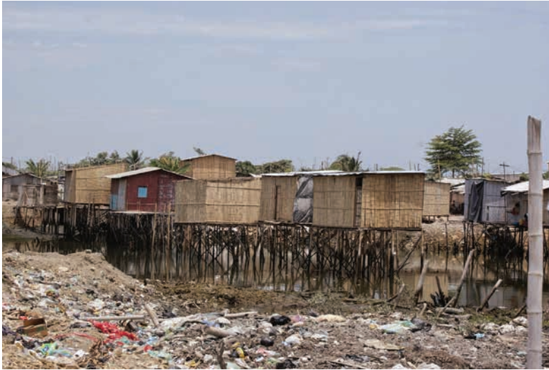
Figura 2 Asentamientos irregulares sobre el estero