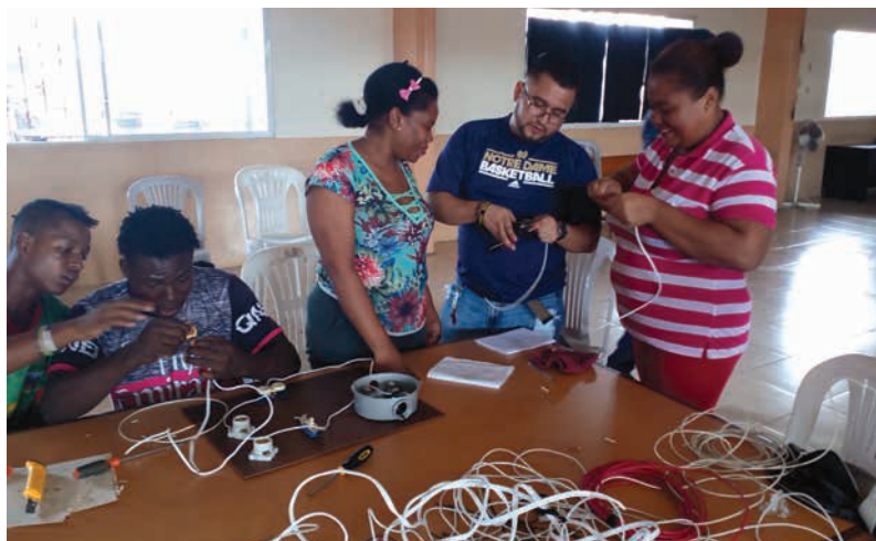
Figura 23 Taller de electricidad básica y seguridad en el hogar

Este proceso consiste en una previa convocatoria a jóvenes y madres y padres de familia del sector, en esta se les invita a los talleres de seguridad y electricidad básica, en estos los estudiantes de las carreras de Electricidad, Electrónica e Industrial, generan un proceso de enseñanza-aprendizaje práctico, en que guiados por un docente de la institución contribuyen con su conocimiento a la mejora de las instalaciones eléctricas de las viviendas del sector, además, esta acción genera que las personas que acceden al curso tengan oportunidades de trabajar como oficiales en las obras eléctricas.