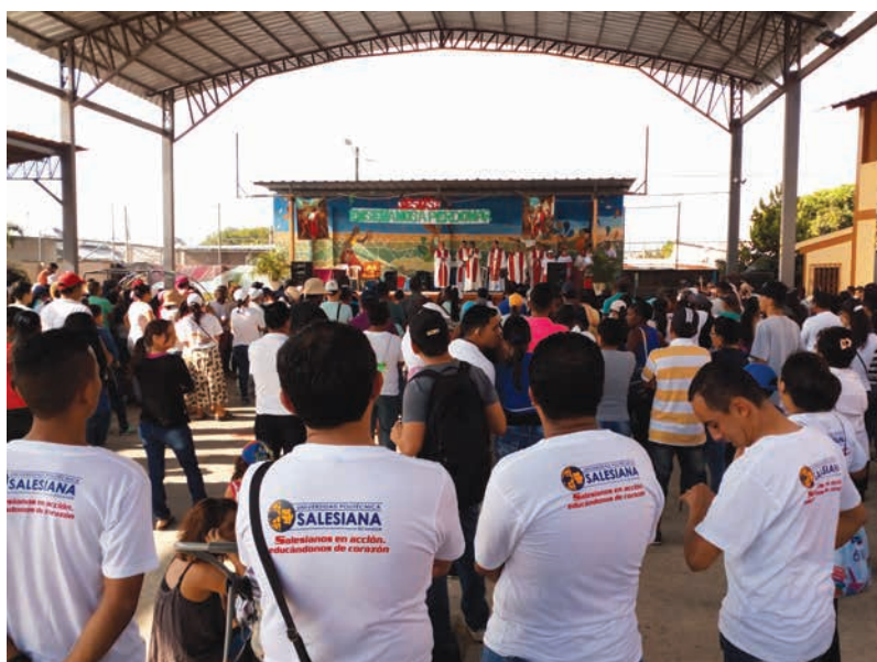
Figura 22 Celebración de Semana Santa

Pascual Juvenil, Chiqui Pascua, etc. El aporte como tal a la comunidad del Barrio Nigeria, comprende un acompañamiento desde el aporte de vinculación de los estudiantes por medio de los conocimientos adquiridos en sus procesos de formación académica, además, los mismos también colaboran en las actividades propias de la semana, mencionadas al inicio de este párrafo.