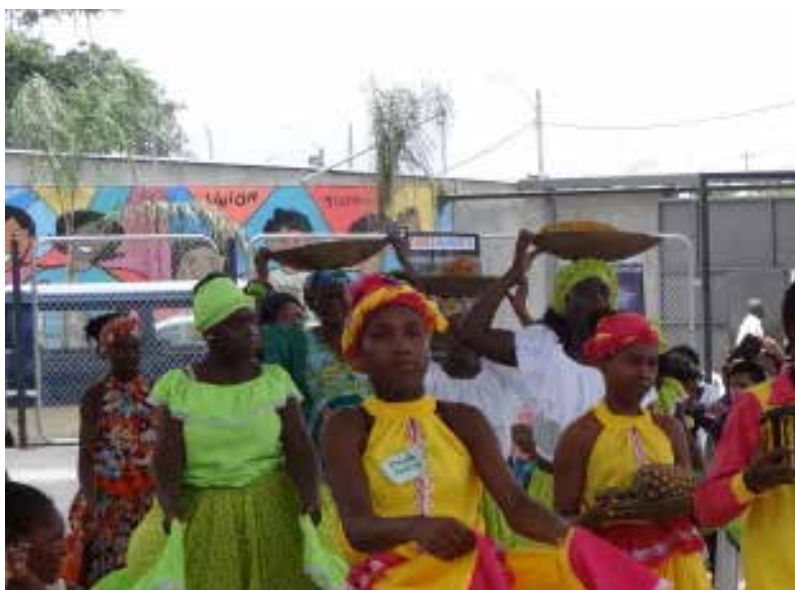
Figura 17 Baile de marimba

Sí, sobre todo me gusta el sonido, uno se siente libre. (B. Valencia, comunicación personal, 22 de marzo 2016)