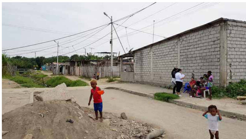
Figura 12 Realidad del barrio Nigeria

Como el autor indica, la situación económica de los afroecuatorianos en el tiempo en que se realizó la Encuesta de Condiciones de Vida, era bastante preocupante, si se confronta con el apartado de este libro (“Breve historia del barrio Nigeria”), concuerda con esa realidad, sobre todo con las publicaciones que se han generado en los diarios de la ciudad de Guayaquil.