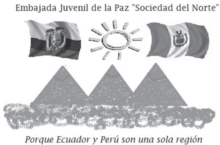
Figura 2 Logo