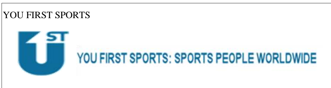
Figura 3. Nombre y logotipo de la empresa YOU FIRST SPORTS Fuente: YOU FIRST SPORTS Elaborado por: Cristhian Palma

DMC SPORTS es una empresa especializada en el manejo de figuras deportivas de fútbol más no de basketball, aun así es estudio de esta compañía permitirá determinar cuál es su forma de trabajo y que medios usa para llegar al consumidor y satisfacer las necesidades.