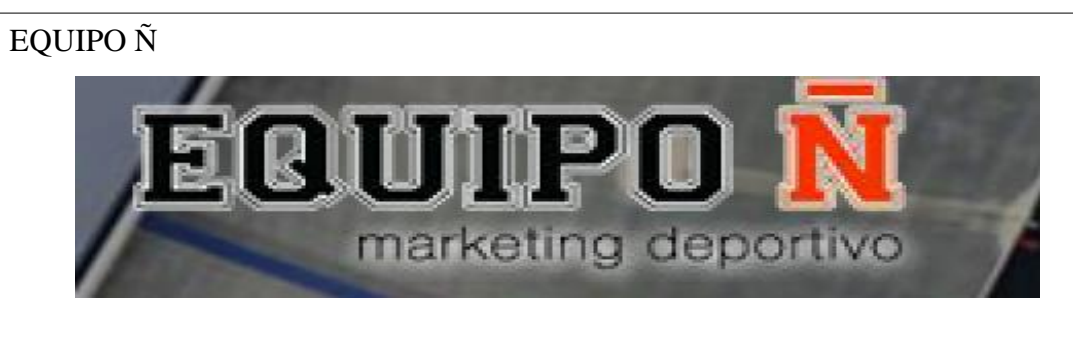
Figura 1. Nombre y logotipo de la empresa EQUIPO Ñ Fuente: EQUIPO Ñ Elaborado por: Cristhian Palma

Antes de poder incursionar en el mercado nacional se investigó a las empresas líderes del marketing deportivo especializadas en el área del basketball.