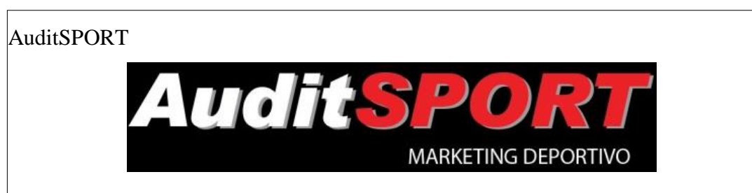
Figura 5. Nombre y logotipo de la empresa AuditSPORT Fuente: AuditSPORT Elaborado por: Cristhian Palma

Para toda empresa es importante tener definida su filosofía empresarial ya que con esta se plantea metas, en el caso de JP SPORT MAKETING se aprecia la forma en la cual trabaja y lo que desea ser a futuro, aunque se observa que la visión es de liderar en el mercado tiene límite el 2015, durante estos últimos años la organización ha realizado eventos deportivos a nivel nacional los cuales han tenido gran acogida en el ámbito del atletismos, aun así sería beneficioso que se enfoque en trabajar en las demás disciplinas tales como el basketball.